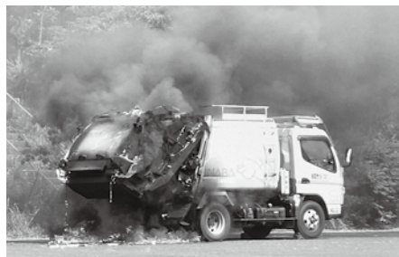
ごみ収集車の火災発生の様子

火災が発生すると、ごみの収集業務等に大きな影響が生じます。安全な収集・処理のため、適正なごみの分別にご協力をお願いします。