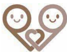
鳥取県男女共同参画推進企業

企業名 ／もりたトーヨー株式会社 所在地 ／八頭町下坂492番地1 業種 ／卸売業、小売業 認定日 ／令和8年3月21日