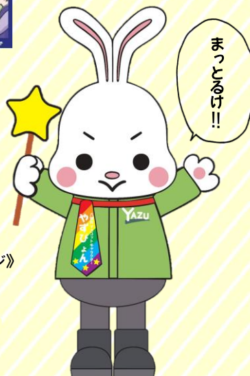
八頭町マスコットキャラクター やずびよん