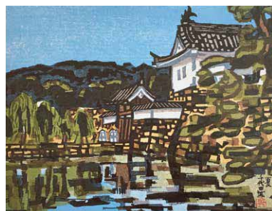
7) 夏 千代田城