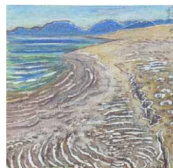
22) 下絵 春(砂丘連作の内)

木版画に刻まれた、水の奏でる音。しとしと降る雨、さらさら流れる小川、そしてザブーンと碎ける波。興家さんの作品からは、まるで水の音が聞こえてくるようです。初夏の光に包まれた「水の景色」を楽しみながら、心静かに流れる時間を感じてみてください。