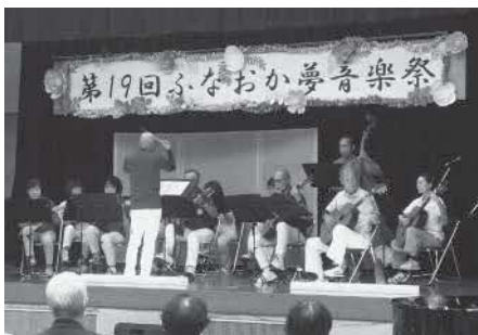
ふなおか夢音楽祭