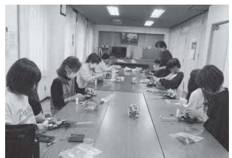
ペーパーアート教室