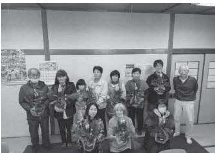
ミニ門松づくり教室