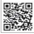
A 大島青松園コース

下記①または②の方法でお申し込みください。 ①右二次元コードから申込フォームに接続し、記入・送信してください。