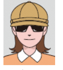
サングラスをかけ人物を特定できないもの