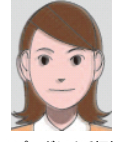
ピンボケや手振れにより不鮮明なもの