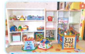
しっかり体を動かして遊べる広い遊戯室

つかまり立ち・はいはいの友だちも安心して遊べる空間(和室)もあります。発達年齢に応じたかわりが楽しめます。広い園庭の裏には、ゆったり遊べる中型遊具があります。