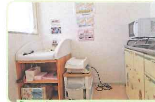
ベビーケアルーム(授乳・おむつ交換)

女性用・男性用・多目的トイレ(車いすでの入室が出来ます)があります。おむつ交換台・ベビーチェアも完備しています。