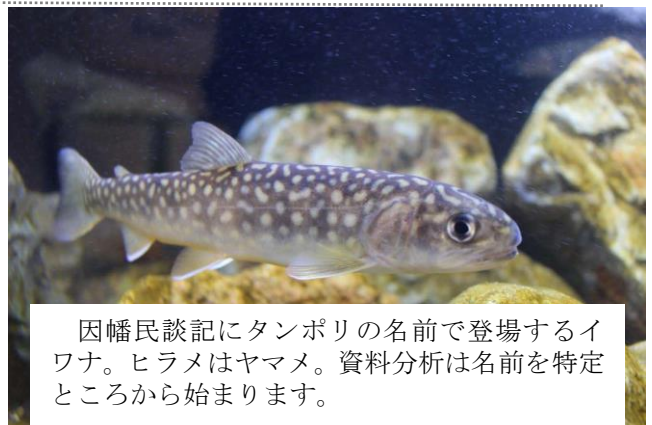
因幡民談記にタンボリの名前で登場するイワナ。ヒラメはヤマメ。資料分析は名前を特定ところから始まります。