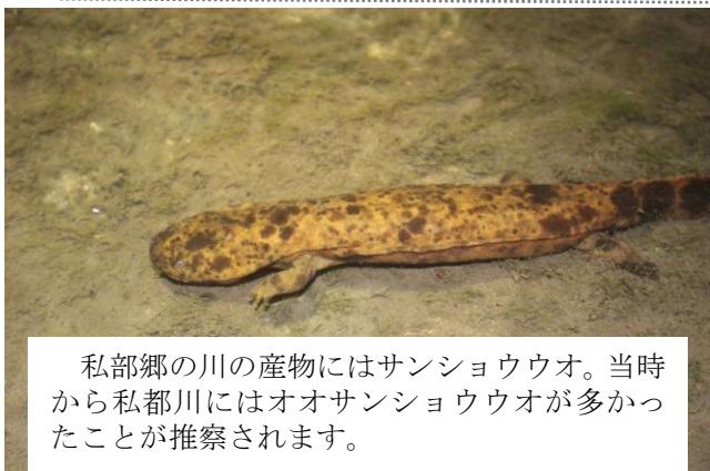
私部郷の川の産物にはサンショウウオ。当社から私都川にはオオサンショウウオが多かったことが推察されます。