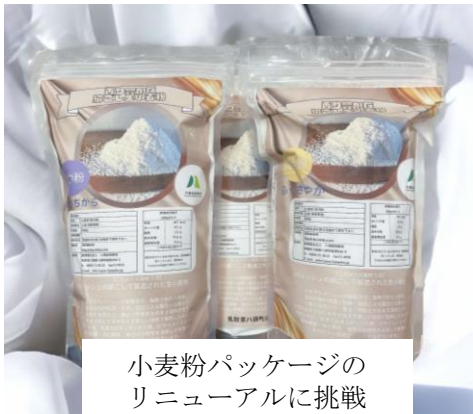
小麦粉パッケージのリニューアルに挑戦