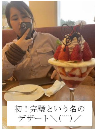
初！完璧という名のデザート\(^^\)/