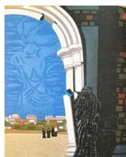
21) 静 A (長崎連作)