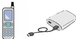
小型充電式電池使用製品 (※電池の取り外しが困難なもの)