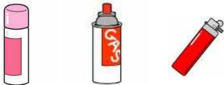
スプレー缶 カセットボンベ ライター