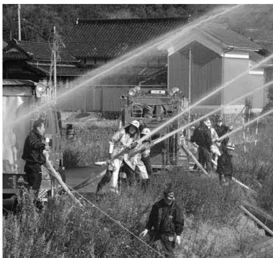
新春の一斉放水(下門尾地内)