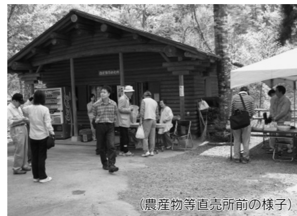
(農産物等直売所前の様子)