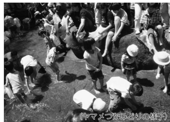
(ヤマメつかみどりの様子)