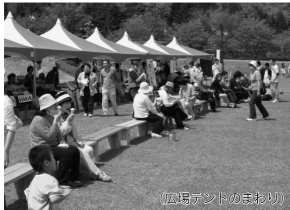
(広場テントのまわり)