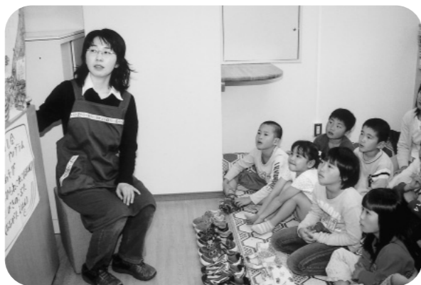
小学生に絵本の読み聞かせ 船岡図書室にて