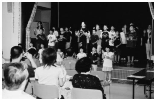
▲昨年手話グループの発表

ここで、解放ということを考えてみると、部落差別からの解放もさることながら、部落問題または、差別観念というしがらみから解放すること、を共に考えようという目的があります。