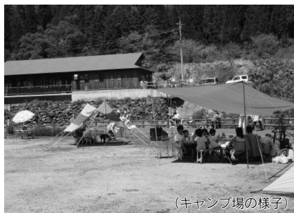
(キャンプ場の様子)