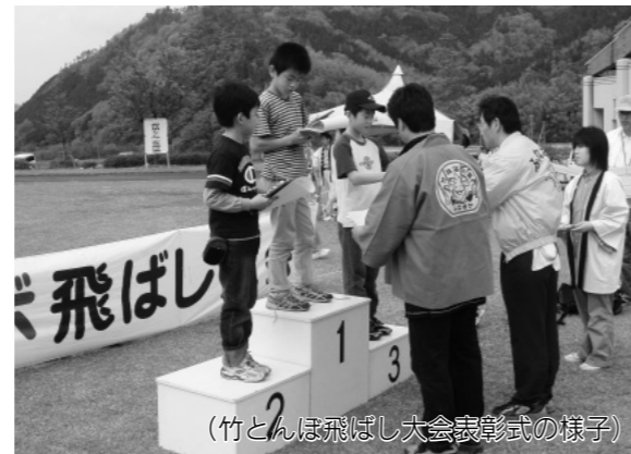
(竹とんぼ飛ばし大会表彰式の様子)