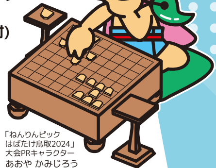
「ねんりんピック はばたけ鳥取2024」 大会PRキャラクター あおや かみじろう

令和6年10月に鳥取県内各地で「ねんりんピックはばたけ鳥取2024」が開催されます。八頭町では将棋交流大会を実施することとなり、そのリハーサルとして将棋フェスティバルを開催します。将棋大会のほかプロ棋士によるトークショーや指導対局会、将棋体験コーナー、クイズコーナーがあります。多くの方のご来場をお待ちしています。