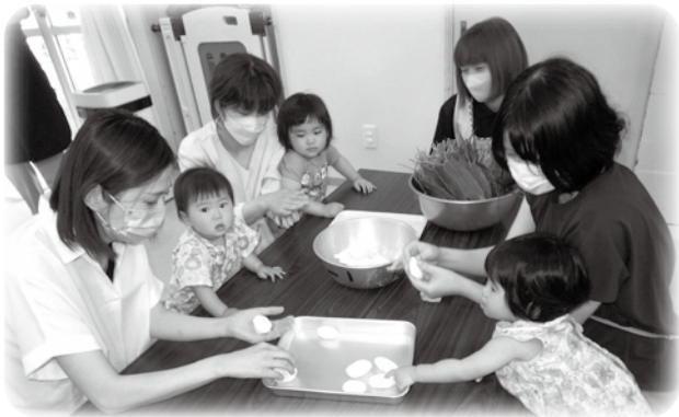
団子をこねこね♪いろいろな笹の巻き方があるんだね

七夕にちなんだお話を聞いたあと、ほんのりとやさしい笹の香りがする笹巻きを美味しくいただきました。