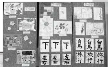
▲前年の小学校生徒作品