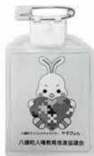
人権啓発ワッペン