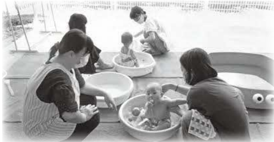
好きなおもちゃで水遊び♪さっぱり気持ちいいね!