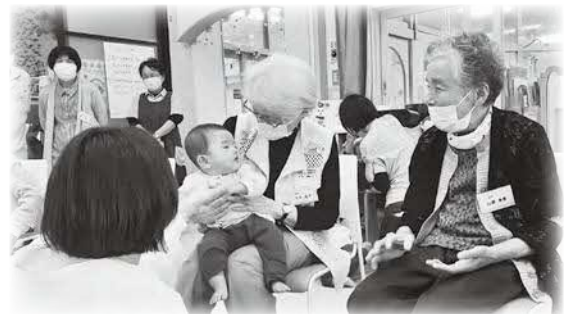
目が合い笑顔に。世代間交流を楽しむ参加者

子どもたちのしぐさや笑顔が地域の方や高齢者の笑顔やパワーとなり、その笑顔や優しい気持ちがまた子どもたちにも伝わります。交流の輪が広がることを願って、今年もさまざまな交流会を開催していきます。