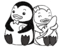
更生ペンギンの ホゴちゃんとサラちゃん