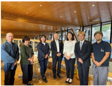
メンバーとの記念写真（上）

令和5年兔年を機に八頭の白兔伝説を活かして町をもり上げるために結成された「やずうさぎプロジェクト」のメンバーとして2年前より活動を行っており、報告会ではメンバーで協議し決めたプロジェクトの目的・コンセプト、そして目的を達成するための取組みとして「川辺の道ウォーキング&サイクリングルート開発・白兔伝説ガイド養成・水引うさぎ結び」などの旅の魅力づくり等についてご説明する機会をいただきました。近頃では「八頭（もうひとつ）の白兔伝説」の認知度が上がり、訪れる人が少しずつ増えていることを実感しています。これまで多くの方に協力いただき、試行錯誤しながら行ってきた活動を振り返る感慨深い報告会となりました。兔年も半分が過ぎましたが、出来る事がまだまだあると考えています。夏詣に風鈴祭り、