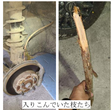
入りこんでいた枝たち