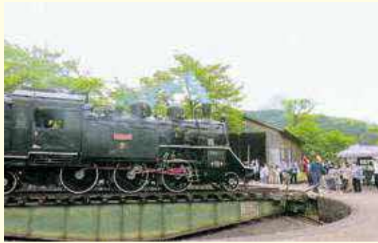
およそ50トンある蒸気機関車。転車台の操作バーをゆっくりと押し、車両の向きを変える子どもたち

若桜鉄道の蒸気機関車を活用し、鉄道利用者や観光客を増やそうと、5月5日（金・祝）の子どもの日に合わせて、若桜鉄道子どもの日イベントが若桜駅で開催されました。好天にも恵まれて多くの家族連れが訪れ、トロッコ乗車や転車台を回す体験を楽しみました。この日、遠くは鹿児島から鉄道ファンも訪れ、若桜鉄道の魅力とその歴史を満喫していました。 今後、若桜鉄道では各種イベントを復活する予定です。SLの汽笛が八頭・若桜谷に響く機会が再び訪れます。