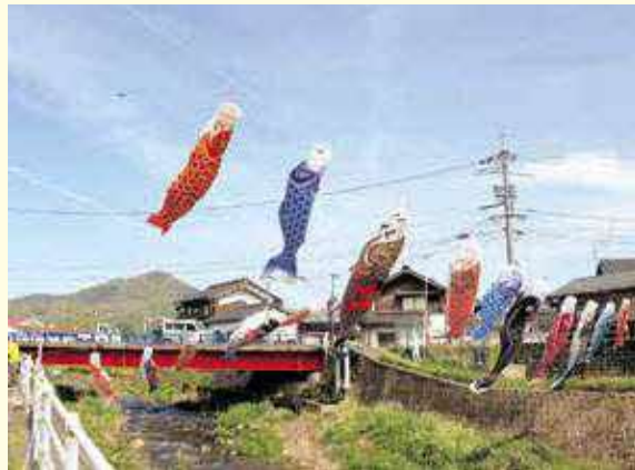
春風に乗って気持ちよさそうに泳ぐ鯉のぼり

因幡船岡駅前を流れる見槻川で4月23日（日）、春の風物詩となる鯉流しの設置作業が行われました。