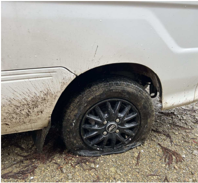
倒木に当たって破裂したタイヤ