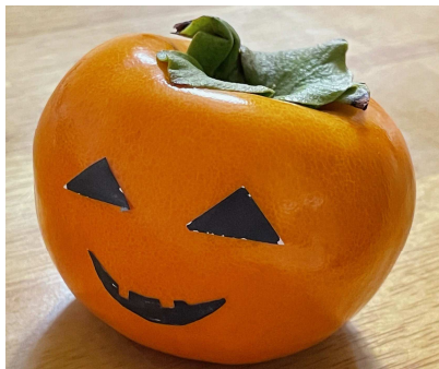
柿のジャックオーランタン