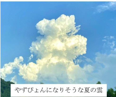
やずびよんになりそうな夏の雲