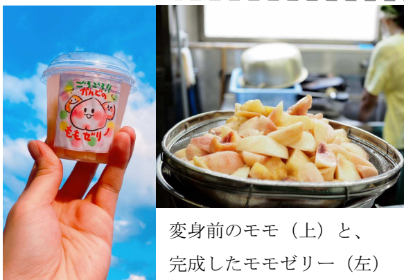
変身前のモモ（上）と、完成したモモゼリー（左）