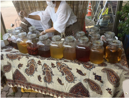
様々な種類が並ぶフルーツ酢