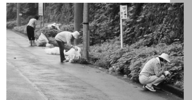
駐車場付近のようす