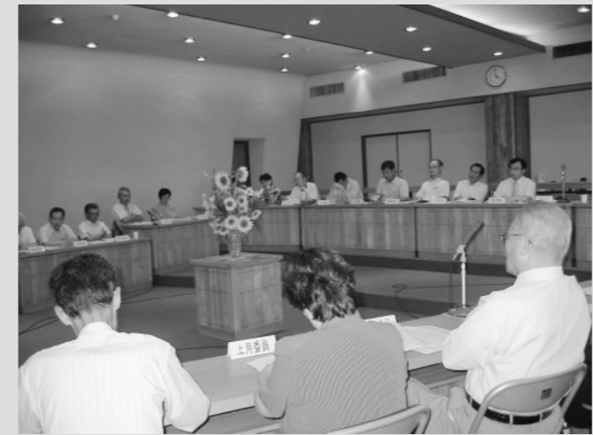
第1回農業委員会の様子

第1回農業委員会を8月8日(月)に開催し、農地法等の申請について、各担当区域の農業委員から調査内容が報告され、それをもとに審議を行いました。 また、地域の担い手となる農業者の育成と集落営農の確立を目指す八頭町農業振興地域整備計画について、「目標数値が高すぎはしないか」「3地域の特性が活かされているか」など活発な議論が行われました。 当日は、今後の農地パトロールや農業委員会における審議に役立てるよう八頭町内の視察も行いました。