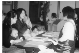
6カ月乳児健診にて

平成15年9月から旧郡家町で実施していたブックスタート事業を、八頭町では、町保健センターで行われる乳児6カ月健診時に、すべての乳児を対象に絵本などの入った「ブックスタートパック」を図書館司書が手渡ししながら“赤ちゃんに絵本を開くひととき”の楽しさと大切さを伝えています。