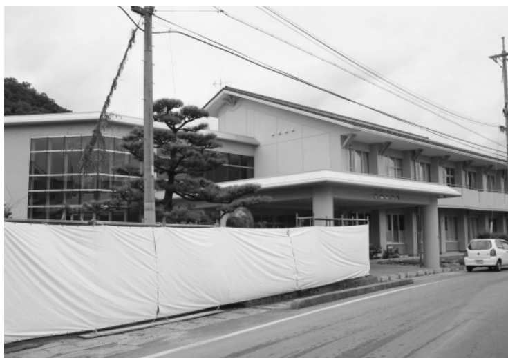
船岡小学校新校舎の概観（平成17年8月23日撮影）

新学期を迎え、新校舎の中で過ごす子どもたちの表情や動作の一つ一つに、これまで以上に明るさと元気が出てきたようであり、建物と同様に輝いて見えます。