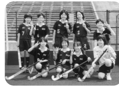
郡家東スポーツ少年団 ホッケー部（女子）

8月5日から8日まで八頭高校第3グラウンドを会場に、全国スポーツ少年団ホッケー交流大会が開催されました。この大会に全国のスポーツ少年団49チーム（男子25チーム、女子24チーム）が参加し、八