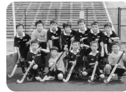
郡家東スポーツ少年団 ホッケー部（男子）