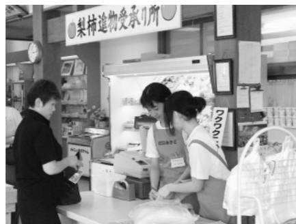
物産館みかどで体験中のようす

職場体験を終えて、それぞれの子どもたちがとてもいい経験をしたと感想を述べていました。短い期間でしたが、学校とは違う場所でのいろいろなことを見聞きすることで、自分の将来を考えるときに役立つ何かをつかんでもらえたと思います。