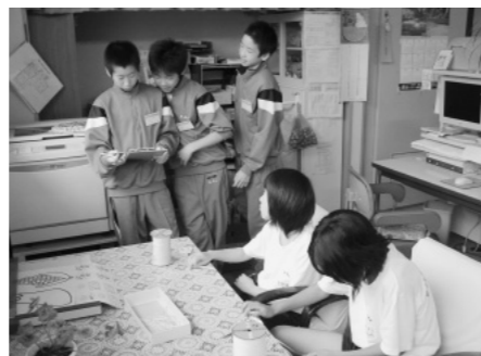
たから保育所で体験中のようす