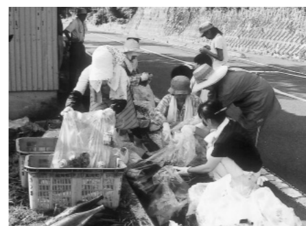
ゴミ仕分けのようす