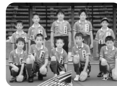
郡家西スポーツ少年団 ホッケー部（女子）

頭町では郡家東・西スポーツ少年団ホッケー部が出場しました。全参加チームが日頃の練習の成果を十分に発揮し、連日の猛暑の中、元気一杯のプレーが展開されました。参加者たちは試合を通じて、全国のホッケー仲間との友情の輪を深め、充実した交流大会となりました。成績は以下のとおりです。