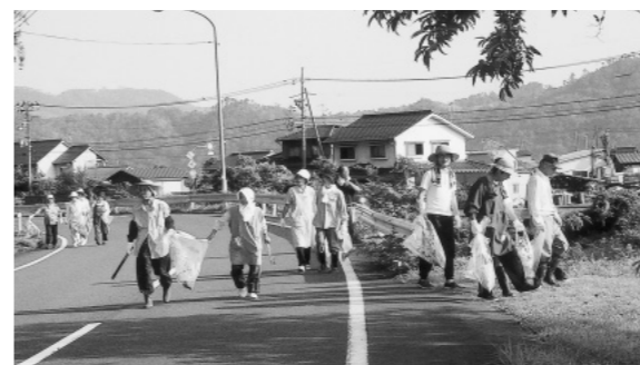
清掃作業のようす