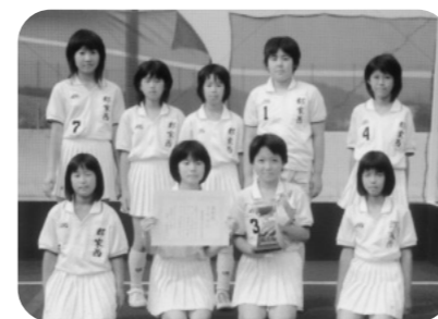
郡家西スポーツ少年団 ホッケー部（女子）