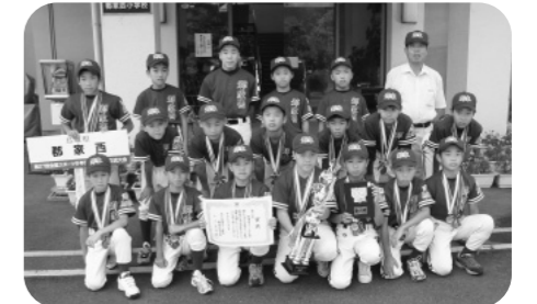
全国大会で三位入賞した郡家西少年野球スポーツ少年団のみなさん

このたび郡家西少年野球スポーツ少年団が第27回全国スポーツ少年団軟式野球交流大会（8月11日～14日の4日間栃木県宇都宮市で開催）に中国地区代表として、7年ぶり3回目の出場