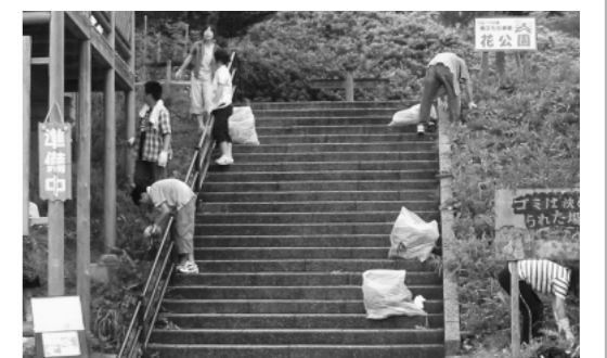
建物付近のようす

「やめようポイ捨て きれいな町で心の交流」をテーマに7月17日(日)、八東地域で清掃作業が行われました。「道の駅はつとう」を中心に約120人の人が集まり、ごみや空き缶拾い、草取りなどを行いました。約1時間半ほどの作業でしたが、用意したダンブが拾ったごみでいっぱいになりました。みんながマナーを守ってごみのないきれいなまちを目指しましょう。