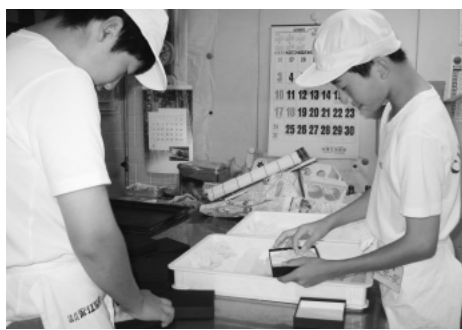
(有)甘味屋で体験中のようす

「学校の勉強とは違うことが体験できてとても楽しそうです。この体験でいろんなことを身につけてください。」