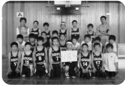
郡家西スポーツ少年団 ミニバスケットボール部 (男子)