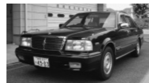
① 公用車(セドリック)