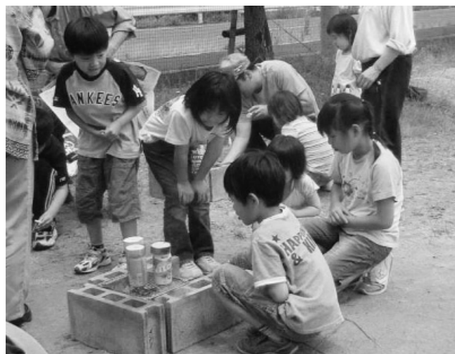
郡家東なんでも体験塾「サバイバル体験」の様相。 缶でご飯が炊けるかなあ…