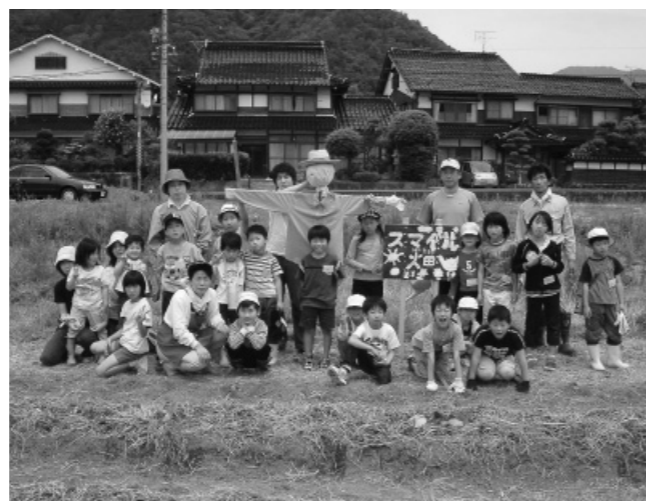
八東なんでもたいけん塾「自分たちの畑をつくろう」 サツマイモをうえました。畑の名前はスマイル畑です