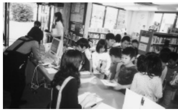
郡家図書館での貸出風景

6月2日、郡家東小2年生42名が、生活科の学習で郡家図書館の見学に来ました。また、船岡小の1～3年生は、6月2・3日に船岡図書室を訪れました。絵本の読み聞かせの後、図書館や図書室のきまりや利用上の心がまえなどの話を聞き、質問を出したりしました。そのあと思い思いに自分の読みたい本を選んで、貸出を受けました。6月中旬には、大江小・隼小の見学会も行われました。