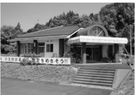
▲船岡文化センター

です。昨年、人権教育主任ということから、初めてこうした場面に参加し得た私です。同和保育では、親や友達、近所の人とふれ合う姿を参観して、幼いころから周囲の愛情に接していく大切さを感じました。高校の授業では、解放研に入って活動している本校出身の卒業生が他の仲間とともに真剣に同和問題を語っている頼もしい姿に感動しました。このような中で、中学校でのありようも考えられてきます。 学校の枠を超えて意見を交流する機会がもてればもっと連携が深まると思います。これから大切なのは、連携により、小・中・高の十二年間、あるいはそれ以上の子どもたちの育ちを見ていくということです。保・幼・小・中高それぞれでの担当者が連携し、一貫した取り組みを行えるようになったら、そのことが「ひとり残らず取り組み」ことにつながっていくのではないのでしょうか。 八頭町となり、地域が広がった新町で、各方面での連携を軸にその差を解消していく取り組みがなされることを期待しています。