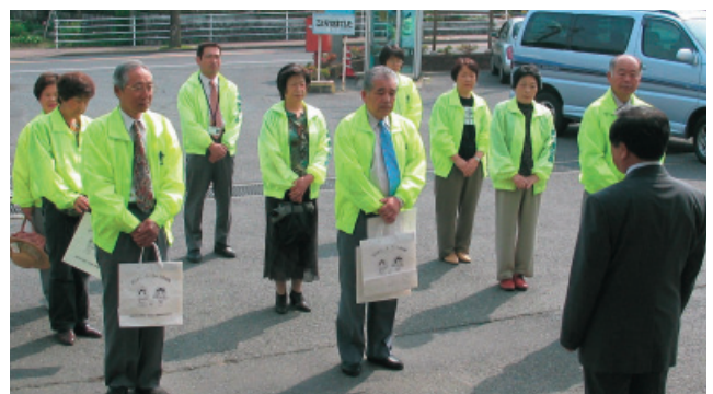
広報活動へ出発するようす (6/1)

今年も人権擁護委員のみなさんとともに、広報車による広報活動やチラシなどの啓発物品の配布を行い、人権を守ることの大切さを呼びかけました。