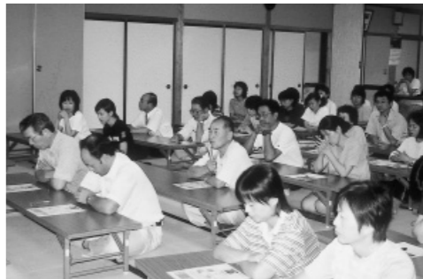
▲昨年の会場のようす