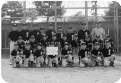
郡家西スポーツ少年団 軟式野球部