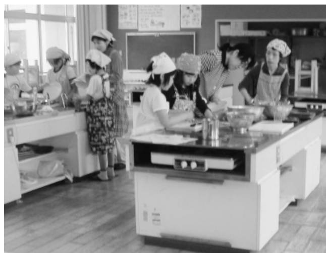
郡家西おもしろ講座「料理・お菓子づくり講座」 バリバリサラダ・みかんゼリーに挑戦中