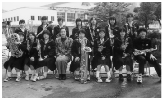
▲指導している吹奏楽部員と

その様な中で、昨年、私の勤務する中学校の生徒玄関に差別落書きが発生しました。この件について、町内あげて取り組みがなされました。その中で、私があらゆる差別を解消するために大切だと感じたのは、「ひとり残らず取り組み」ということです。部落差別がいつまでたっても解消しないのは、その取り組みに差があるからです。国民的課題とはいえず、都道府県間の格差には大きなものがあると思えます。その解決に踏み込むにはかなり無理がありますが、