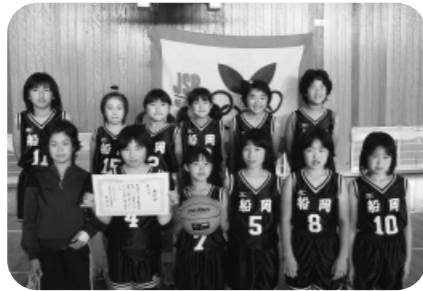
船岡スポーツ少年団 ミニバスケットボール部 (女子)