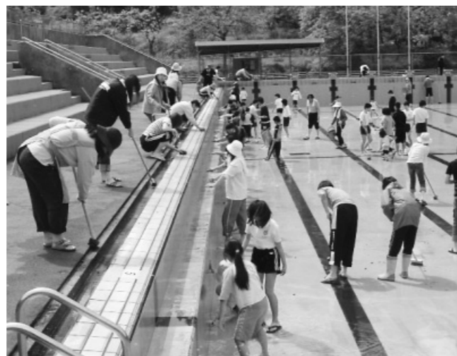
船岡子ども教室「隼プール斉清掃」 隼地区住民も、子どもたちと一緒に汗を流しました。 参加者数 162名