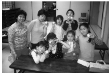
▲英語教室のようす

事業として、啓発活動は、例年十二月(今年、十一月に開催予定)の人権週間、「文化センターまつり」を開催しています。文化センターを会場に、