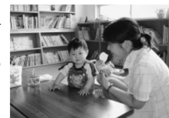
子育てをお手伝いします