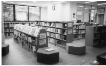
船岡図書室児童コーナー

新しくなった船岡図書室では、大人向けの小説やエッセイだけでなく、園芸やスポーツ・歴史に関する本、児童用の絵本なども新たに1万冊そろえました。以前からの7千冊の本も加え、たくさん本をわかりやすく整理して、皆様のお越しをお待ちしています。