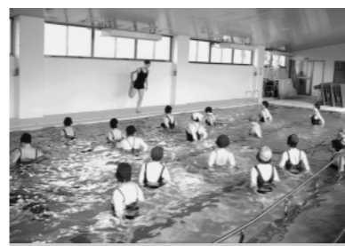
八東保健センター 温水プール (道の駅はっとう道向い)

水中運動といえば、水泳という発想になるかもしれませんが、水の中で歩く、体操をするだけで多くの利点があります。持病がある方については、主治医に水中運動を行って良いかの了解を得ておいてください。 水着姿になるのが恥ずかしいとよく言われますが、はじめてみれば気にされることはなく、水の中に入っただけでさえ見えません。水着の色も色々あつて、おしゃれも楽しめるようです。気軽に安全に楽しみながらできる水中運動をぜひ体験してみてください。お友達と誘い合つておいでください。