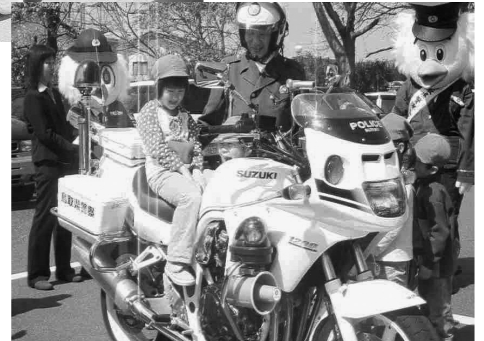
白バイ・パトカーに乗せてもら う園児たち。「おっきーなー!」 「かっこいい!」

4月6日から4月15日まで春の全国交通安全運動が行われました。 期間中は郡家警察署管内・八頭町内の交通安全行事として、朝の街頭指導や広報検問・交通 安全指導員研修会等が行われました。また新入学期が始まることから、各種交通安全教育を 中心に取り組みをおこなってきましたが、交通事故防止のためには各家庭や地域から声をかけ あうことが必要です。 期間中にも県内で交通死亡事故が多発し、「交通死亡事故多発警報」も発令しております。 八頭町から悲惨な交通事故を出さないよう、皆さんの日頃の対策と、啓発をお願いいたします。