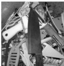
なんと刃物が入っていました。危ない!

袋内の異物は手選別で取り除きますが、異物が多いと、どうしても取りきれません。また、洗っていないものがあると処理場の衛生を損ないますし、結局は焼却処分されます。ケチャップの容器などは真ん中で切ると簡単に洗えますので、必ずさつと洗って出してください。洗えない物や汚れのひどい物は、可燃ごみに出してください。