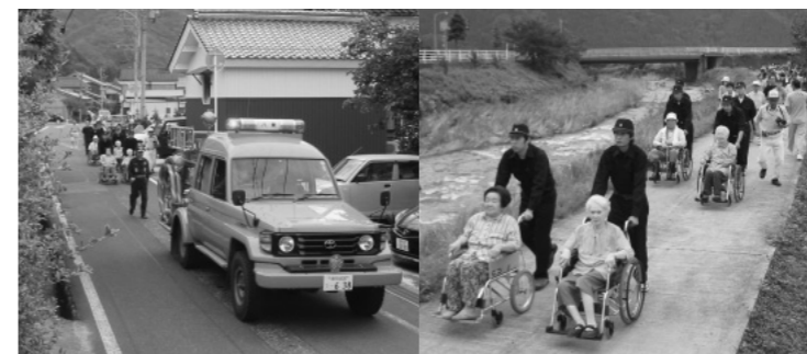
富枝集落避難訓練の様子

八頭町では、今後も速やかに災害に対応できる体制の確立をめざして、行政と町民が連携した防災活動を推進していきます。