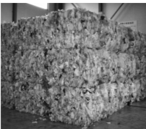
圧縮梱包されたプラスチック

分別されたプラスチックは、圧縮梱包されます。この時に、異物が多かったり、汚れがひどいと、リサイクルする材料としてのランクが下がり、最悪の場合、リサイクル出来なくなってしまうのです。