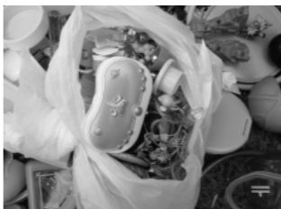
金属などが付いている場合は、小型破砕ごみへ

プラスチック以外のものは、それぞれの分別の区分に出してください。おもちゃなどで、ネジや鏡などがついていて、分別できない場合は小型破砕ごみに出してください。