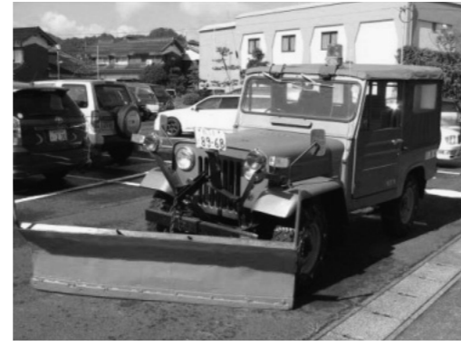
(昭和57年11月登録、車検満了日：平成19年12月21日)