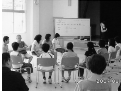
竹内さんのお話のようす

8月2日(木)に八東隣保館において小学校地区児童5・6年生の交流会を実施しました。児童は全部で14人の参加でした。この交流は6年生が中学校に進学するまでに、お互いの仲間づくりを図るとともに、思いを伝え合い支えあう中であらゆる差別に立ち向かう心を養う目的で以前から実施しています。従来は八東ふるさとの森でカレイライスなどを作り自然の中で交流しておりましたが、今回は八東隣保館で開催しました。