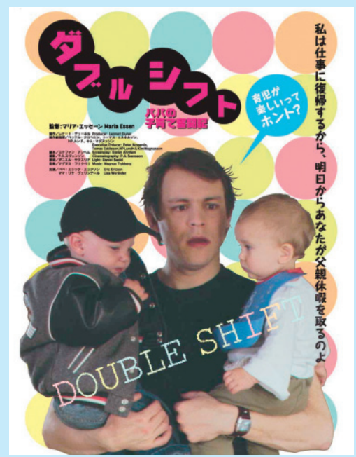
～パパの子育て奮闘記～