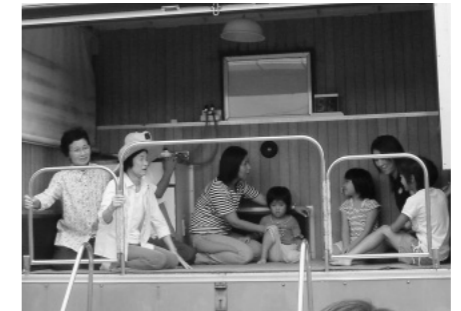
起震車で地震の揺れを体験

地震の体験では、地震車に数名ずつが乗り込み、地震の横揺れ、縦揺れなどを体験しました。 煙の中の避難体験では、締め切った教室内に煙を充満させて、視界の利かない状況で、壁を手探りで進む避難体験を行いました。 消火器の操作体験では、八頭消防署の職員から「①安全栓を引き抜く。②ホースをは