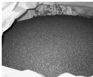
粒状に精製されたプラスチック

現在、これらのプラスチックは固形燃料になったり、粒状に精製されてプラスチック製品の材料になっています。そして、公園の擬木や、パレットなどに生まれ変わっています。