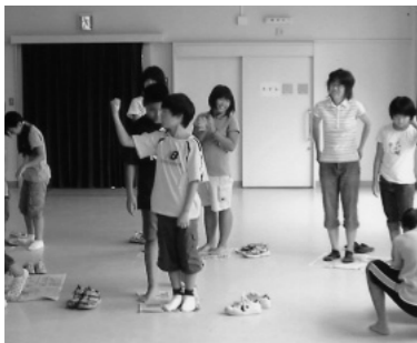
楽しいゲームでみんなと交流

世にたった一人しかいないからです。また、大切なものは命です。人は生まれて来るところを選ぶことができない。」と繰り返して話されました。その後、地区学習会の意義について話され、「差別にまけない力・差別を見抜く力・差別をなくす力を養い、自らの社会的立場の自覚を深め、部落差別をはじめとするあらゆる差別を見抜き、仲間とともに差別をなくすために学習している。」と話されました。