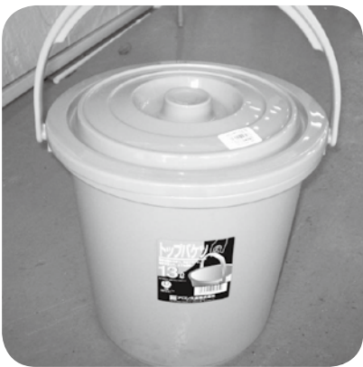
無償配付される家庭用バケツ

この事業は集落単位での取り組みになります。この事業に取り組み集落には、町が各家庭用のバケツ(13リットル)を無償で配付します。この事業の説明会を各集落に出向