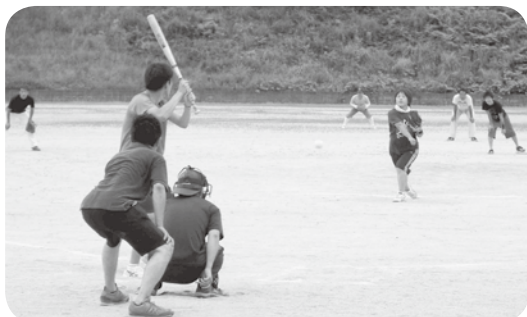
ソフトボール大会の様子

船岡地域のつながりが希薄になったとの声があり、各地区公民館と協議し、地域の連携・健康維持のため、2回のスポーツ大会を計画しました。 最初は、「ソフトボール大会」を