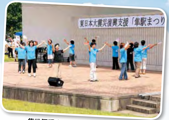
隼地区婦人の有志による「隼音頭」

8月7日(日)、若桜鉄道「隼駅を守る会」主催による東日本復興支援「隼駅まつり」が船岡竹林公園で開催されました。 3回目となる今年の「隼駅まつり」は、震災による自粛ムードと高速道路の通行料金変更などが影響したためか、昨年の600台を下回りましたが、北は北海道函館、南は九州鹿児島など全国各地から大型オートバイ「隼」などが400台以上集結しました。 開会行事、集合写真を撮った後、ライダーを歓迎しようと隼地区婦人の有志による「隼音頭」の初披露と智頭町のダンスチーム「輪舞(ロン