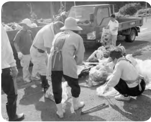
船岡地域の清掃活動