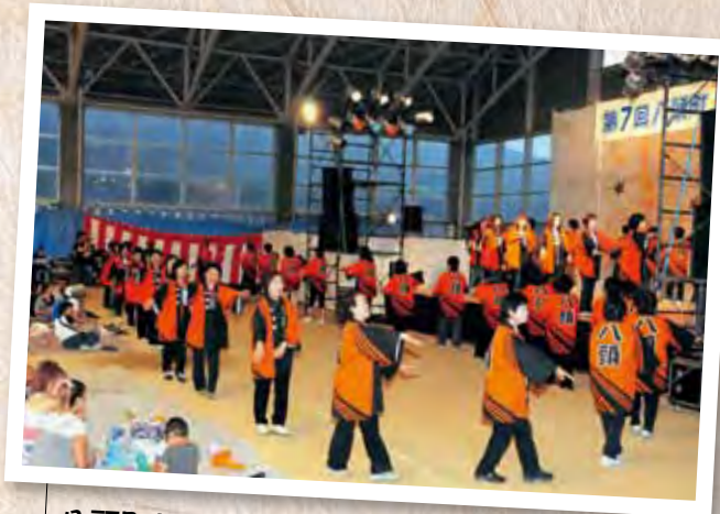
八頭町女性団体連絡協議会