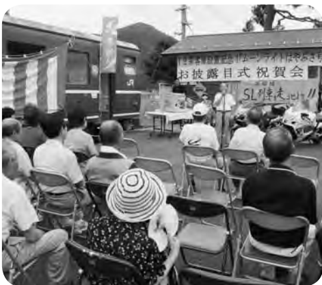
お披露目式の様子

西村会長は「この車両は、県外から訪れる準ライダーの休憩場所として、また、地域の方の憩いの場として活用していきたい」と語りました。