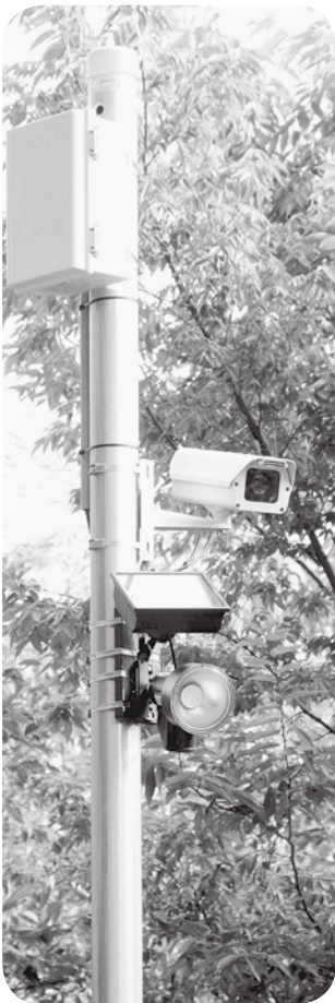
町内に設置された監視カメラ