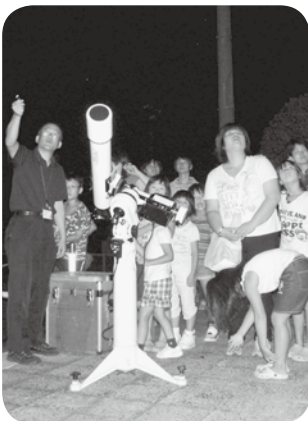
星空観察会の様子

★9月18日(日) 10:00～11:40 ◎映画下ラえもん 「のび太の人魚大海戦」 伝説の人魚の剣をめぐる て練り広げられる大冒険 物語です。