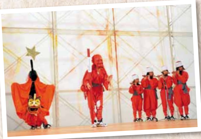
市場少年キリン獅子クラブ