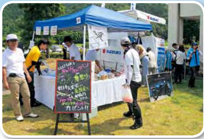
スズキによる義援金の呼びかけ