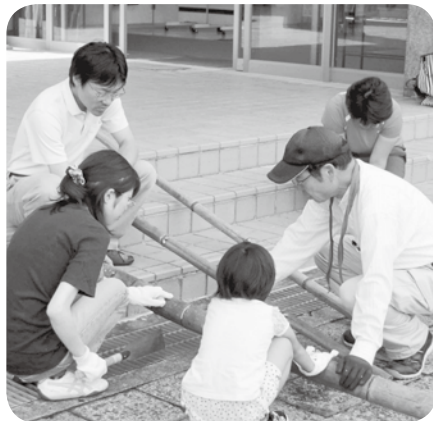
サバイバルクッキングの様子

子どもおもしろ体験事業の一環として、7月23日(土)にサバイバルクッキング、7月29日(金)に星空観察会を実施しました。 サバイバルクッキングは、手打ちうどんを作り、竹で作った自家製の箸と器を使って食事しました。 星空観察会は、遠い星空に思いをはせながら、星座を学び、天体望遠鏡を使って観察しました。