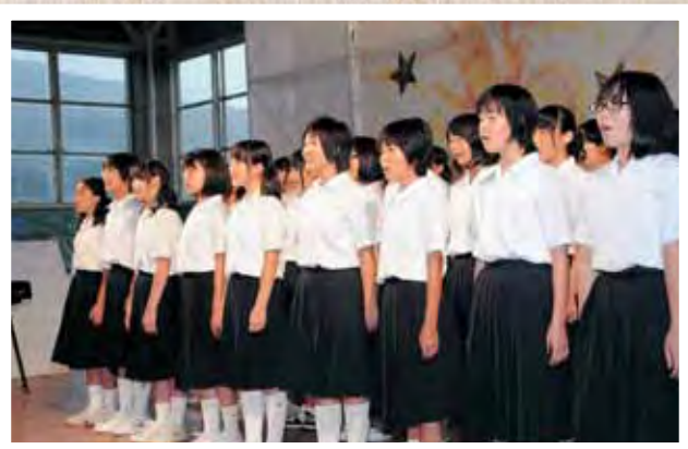
船岡中学校合唱部