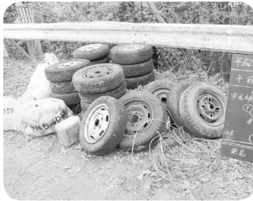
町内で回収された不法投棄物