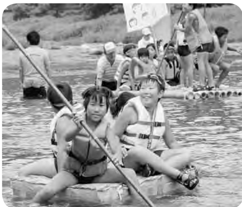
牛乳パックのいかだ

参加した子どもは「初めてカヌーを漕ぎました。最初は同じ所をクルクル回っていました。少ししたら前に進むようになりました。また乗りたいです」「魚を捕まえることができなかつたけど、見つけて追いかけるのが楽しかった」などと言っていました。