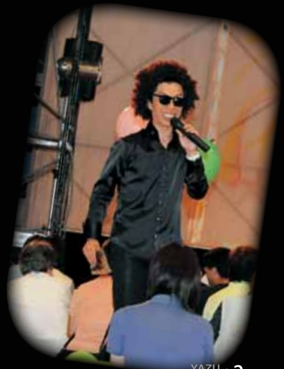
セニョール玉置ものまねショー