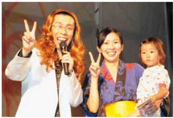
きらめき大抽選会の假屋崎省吾 (セニョール玉置) (左)