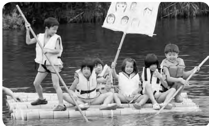
いかだに乗って川くだり