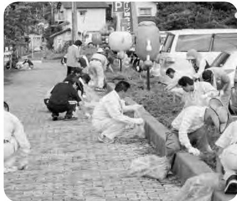
道の駅「はつとう」周辺の清掃

7月23日(土)、町内外から約100名のボランティアが参加して、清掃活動「ひまわりクリーンクリーン作戦」(郵便局主催)が道の駅「はつとう」周辺と用呂パーキングで行われました。