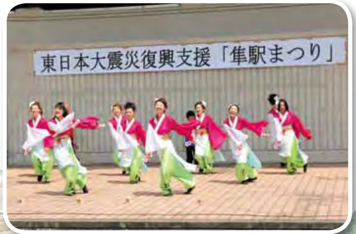
エネルギーな輪舞(ロンド)の踊り

8月7日(日)、若桜鉄道「隼駅を守る会」主催による東日本復興支援「隼駅まつり」が船岡竹林公園で開催されました。 3回目となる今年の「隼駅まつり」は、震災による自粛ムードと高速道路の通行料金変更などが影響したためか、昨年の600台を下回りましたが、北は北海道函館、南は九州鹿児島など全国各地から大型オートバイ「隼」などが400台以上集結しました。 開会行事、集合写真を撮った後、ライダーを歓迎しようと隼地区婦人の有志による「隼音頭」の初披露と智頭町のダンスチーム「輪舞(ロン