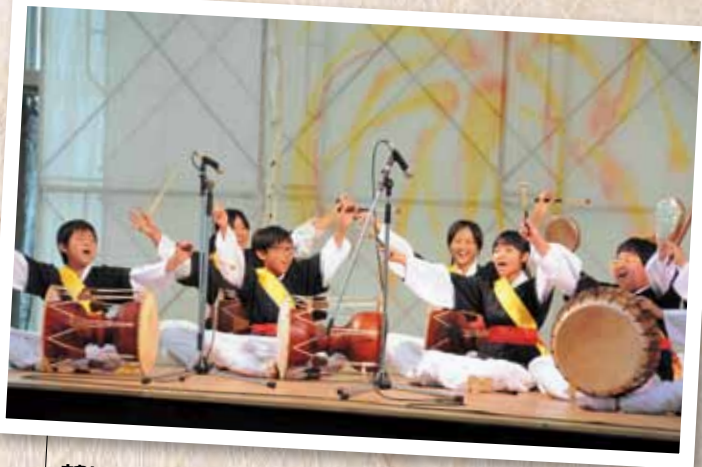
韓国横城郡の子ども