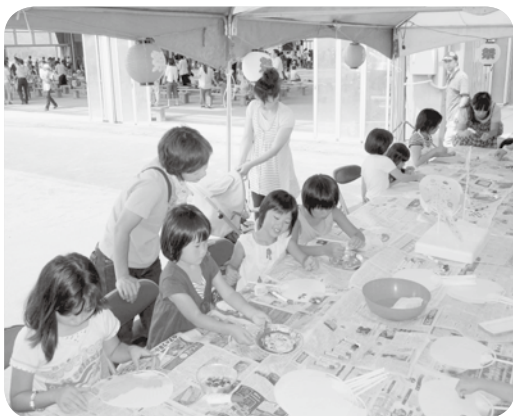
うちわづくりコーナー