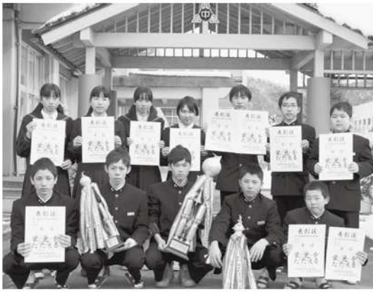
八東中学校スキー部員