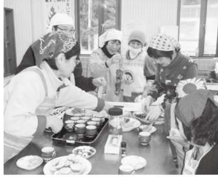
手作り燻製料理教室

1月26日(日)、男性3名を含む17名の方に参加いただき、手作り燻製料理教室を開催しました。