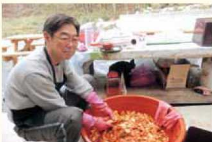
キムチ作りの手伝い