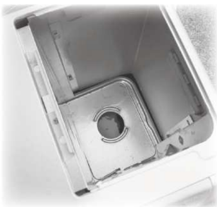
給油タンクの下に灯油が残っています

にしてください。 灯油が残っているものは火災の恐れがありますので、回収しません。