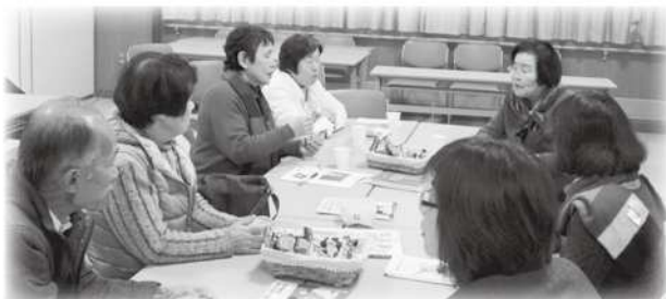
映画鑑賞後の座談会

参加者からは、「憲法9条くらいしか興味を持ってなかったが、こんな風に憲法が作られたという事を初めて知った。」「草案でカットされた部分を改めて見ると、今の世の中に必要なものが多くあると思った。」「この当時にこのような考えを持つ女性がいらしたことは素晴らしいこと。」などの意見がありました。