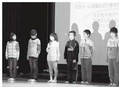
八東小学生の発表

第2回 八東川フォーラム（NPO法人 八東川清流クラブ主催）が1月19日（日）、八東体育文化センターで、100人を超える参加者を迎えて開催されました。