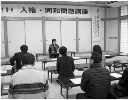
人権・同和問題講座の様子