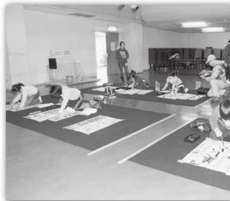
書き初め大会の様子