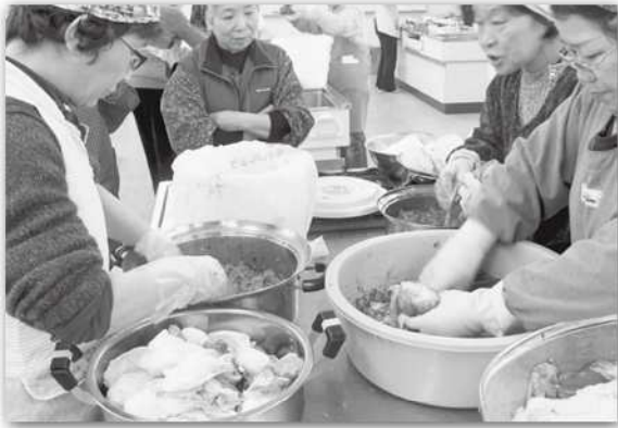
キムチ作りの様子

八東・丹比地区公民館共催の自家製キムチ作りを12月15日(日)、八東体育文化センター調理室で開催しました。 大根、人参、ねぎ、にんにく、生姜りんごなどの材料を刻み、タレとよく混ぜ合わせ、各家庭で塩漬けした白菜の葉1枚1枚に挟み込んで、桶に漬け込みました。 乳酸菌の発酵で漬けてから1か月後が栄養もあり美味しくなることで、参加者はそれぞれが食べられる日を楽しみにしながら、オリジナルのキムチを持ち帰りました。