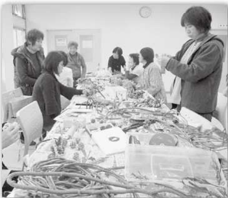
リース作りの様子