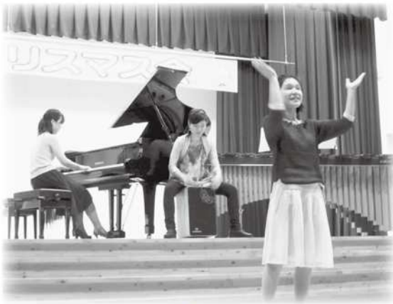
クリスマスコンサート

男女共同参画センター「かがやき」・八頭町子育て支援センター・ファミリーサポートセンター合同のクリスマスコンサートが12月17日（火）に、子育て支援センターを利用している親子と町内の園児合わせて240名余りが参加して、八東体育文化センターで開催されました。