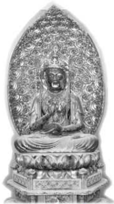
聖観音菩薩像（青龍寺）

また、船岡観音堂の聖観音菩薩像は、胎内に墨書があり、仏像の造立に係わった約60人の施主の名前が書かれ、仁治2年（一二四一年）に造立が始まったことが明記されており、資料的価値も高いものです。これら鎌倉期の秀作は、県内でも意外に例が少なく、後世に引き継いでいくべき貴重な文化財です。