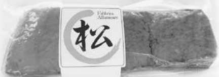
手づくり燻製ベーコン

また、保存料・発色剤・増量剤を一切使用していませんので、体に優しい製品です。ぜひ一度ご賞味ください。 なお、生産量が少ないため受注生産とさせていただきます。ご注文をいただいたから手間と時間を惜しまず、丁寧に製造しますのでお届けまでしばらくお時間をいただいております。