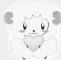
鳥取県「眠れてますか？」 睡眠キャンペーン イメージキャラクター「スーミン」