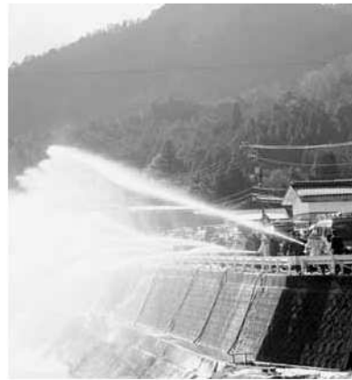
新春の一斉放水(岩測地内)