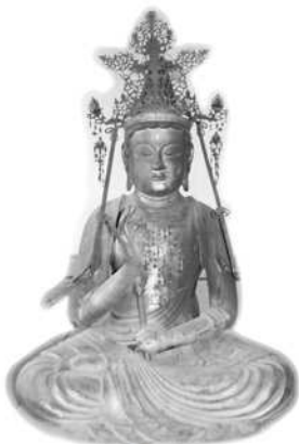
聖観音菩薩像（船岡観音堂）