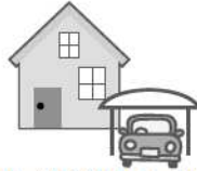
駐車場・資材置場にしたい など