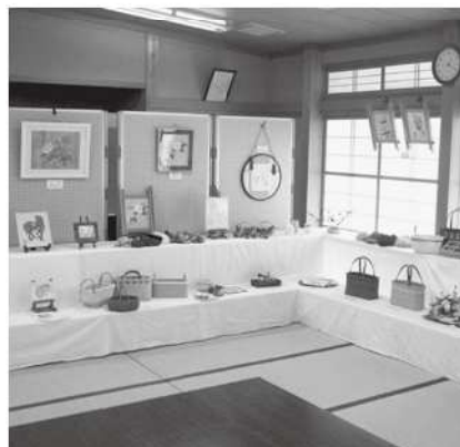
集会所の作品展示