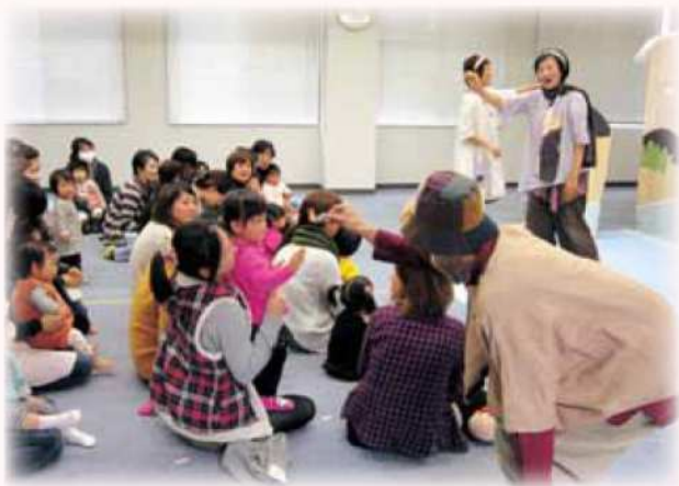
アートスタートの様子

演奏開始まで、会場内はザワザワとしていましたが、開演すると子どもたちは、静かになり演奏に聞き