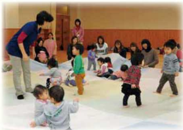
ミュージック・ケアの様子