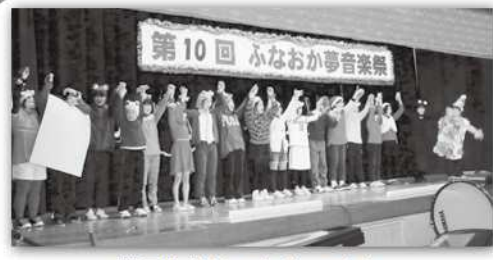
船岡小学校6年生の合奏

中でも、船小の「明日が聴こえる」では、ステージに駆け上がり力いっぱい、歌って、踊って、若さあふれる踊りを見せてくれました。力強い演奏と踊りの中に音楽を通じてつながりあえる児童の姿を見ることができ、主催者の一人としてこれに勝る喜びはありません。