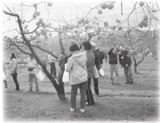
柿狩りを楽しむ参加者

11月27日（水）、町外の福祉施設等に入所されている八頭町出身の障がいのある方15名をお迎えして、八頭町里帰り事業を開催しました。