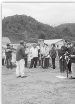
新井三嶋谷墳丘墓の視察

11月10日(日)、あいにくの雨天にもかかわらず18名の参加により、岩美町の新井三嶋谷墳丘墓や香美町の応挙寺として有名な大乘寺、紅葉が盛りの猿尾滝(日本一の滝百選)などを訪れました。悠久の歴史を感じ、自然の営みの素晴らしさも感受できた探訪となりました。