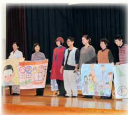
男女共同参画推進委員による寸劇

いつも笑顔で暮らすこと。妻が笑顔なら子どもはすくすくと育ち、亭主は仕事にハリが出る。その笑顔を引き出せるのは、わたしたち亭主だけなのだ！