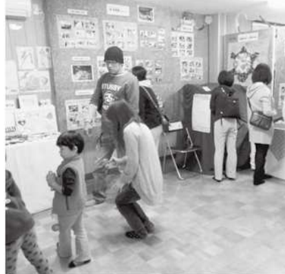
児童館の作品展示