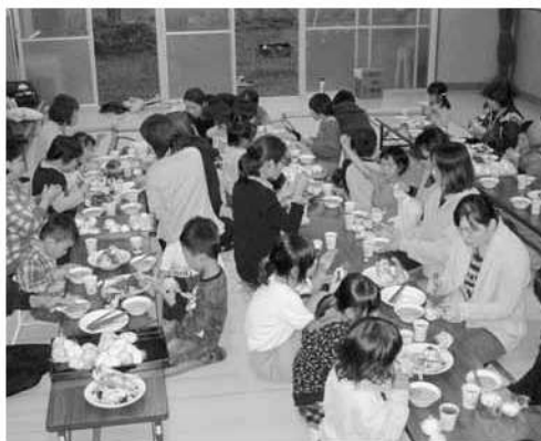
親子で楽しい会食