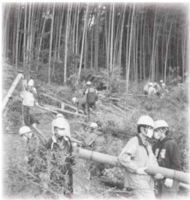
竹林整備をする参加者