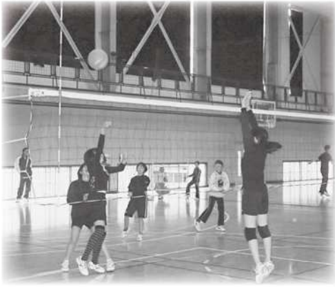
ソフトバレーボール大会

八頭町スポーツ推進委員会では毎年このイベントを開催し、町民みなさんの健康づくりのきっかけにしたいと考えています。