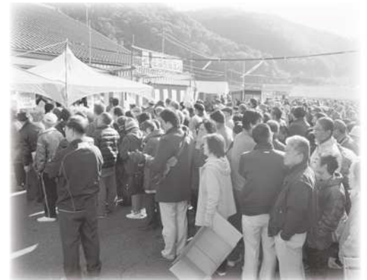
花御所柿を買い求める買い物客

第18回花御所柿祭り（物産館みかど主催）が12月1日（日）、物産館みかどで開催され、約3千人の来場者でにぎわいました。