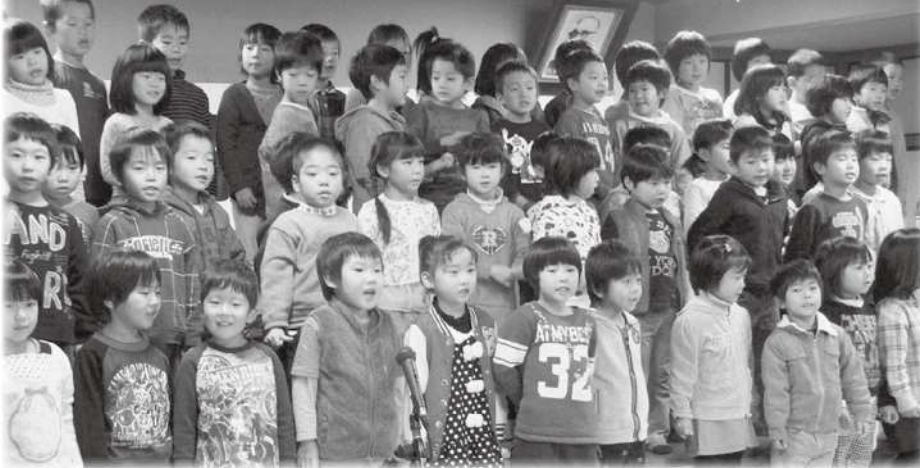
保育所児童の合唱

多くの方に来場していただき、「部落解放を八頭町に暮らすすべての人々の課題に」をテーマに有意義な解放文化祭になりました。