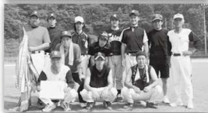
▶ドミールこおげチーム