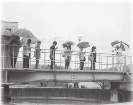
下水処理施設の見学

また、8月26日（月）に、同様の第2回見学会を八東地域の水道浄水場及び下水処理施設で開催しました。