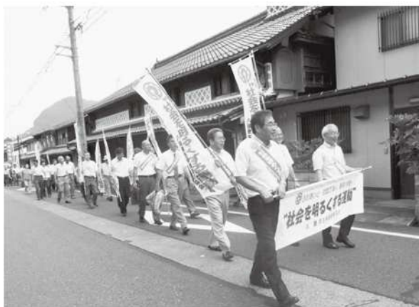
広報パレード (若桜町地内)

なお、この大会は町民の皆様からの「愛の協力募金」としていただいた賛助金をもとに開催しました。