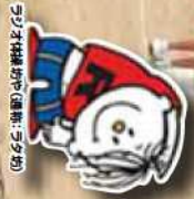
ラジオ体操おや(通称:ラジお)