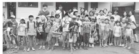
▲参加者のみなさん