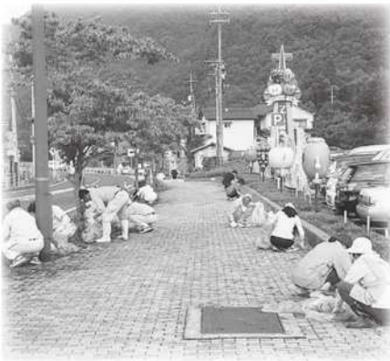
道の駅はつとう周辺の草刈り

また、郡家地域では、八頭町建設業協会(郡家地域)が、郡家球場周辺の草刈りを行いました。 ご協力ありがとうございました。