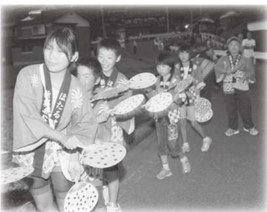
新興寺ほたる音頭

祭りが終わった午後8時を過ぎると谷川の上流でホタルが乱舞し、幻想的な空間を呈していました。