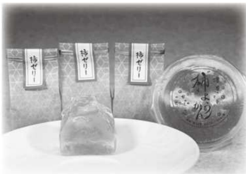
柿ようかん(右)と柿ゼリー

このため、積極的勧奨を差し控えますが、定期予防接種として受けることはできます。すでに接種券をお持ちの方で、接種を希望する方は、接種の有効性及び安全性等について十分説明を受け納得したうえで受けてください。