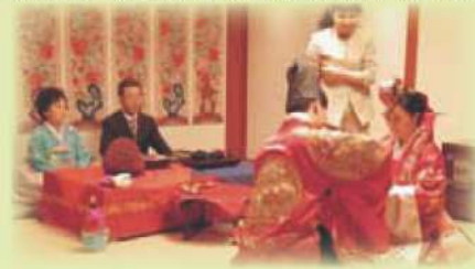
ベベク(韓服で新郎の両親にあいさつ)

韓国では日本と同じように、5月と9月に結婚式がたくさんあるようです。5月は本当に多く、結婚式場に行く去何組もの結婚式が行われています。私も