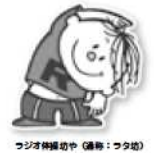
ラジオ体操のや (講師：ワタシ)