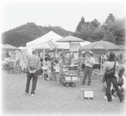
クラフトキャンプ

2日には、ステージで歌やギター演奏などがあり、芝広場の開放的な空間でゆったりとした時間を過ごしていました。