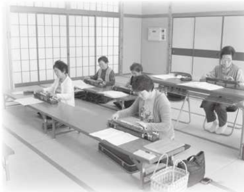
大正琴教室の様子

郡家人権啓発センターでは人権啓発活動の一環として地域交流事業の各種教室を引き続き開催しています。4月5日(金)には、東市場老人憩の家で大正琴教室の開講式を行いました。