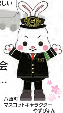
八頭町 マスコットキャラクター やずびよん

4月5日(日)午前9時より「ぷらっとぴあ・やず」にて八頭町観光協会主催のオープンイベントを開催します。皆様のご来場をお待ちしております!