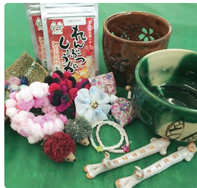
「れんぶつオーガニック」「工房遊」「細田酒店」「陶器 北村」の商品

きらめきプラザ八頭で販売している商品をご紹介します。 今月は「河原木材」「特別栽培米」「表札 山根」「木彫り置物 村口」「れんぶつオーガニック」「工房遊」「細田酒店」「陶器 北村」の紹介です。 「河原木材」は、木材で作った写真立てや椅子などで、「特別栽培米」は、鳥取県の認証を受けた酵素(バイオ)農法で作られた自然の恵みいっぱいのおいしいお米です。「表札 山根」は樺の表札で、ご希望の方には字彫りも行つていただけます。