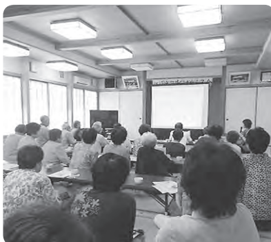
認知症予防講座の様子

また、同時に「認知症予防講座」、そして、認知症になっても住み慣れた地域で一緒に暮らしていけるように「認知症サポーター養成講座」を行っています。