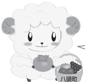
八頭町「眠れてますか？」睡眠キャンペーンキャラクター「スーミン」

ひとりでは悩まないで相談しましょう。まわりの人や身近な人に声をかけてみましょう。