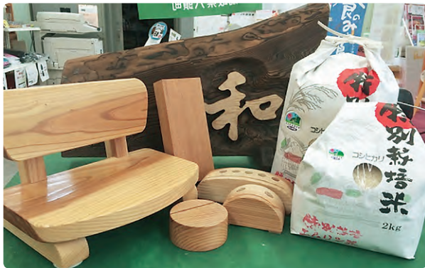
「河原木材」「特別栽培米」「表札 山根」「木彫り置物 村口」の商品

4月5日(日)午前9時より「ぷらっとぴあ・やず」にて八頭町観光協会主催のオープンイベントを開催します。皆様のご来場をお待ちしております!