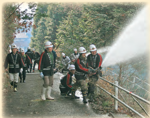
青龍寺付近での消火訓練の様子