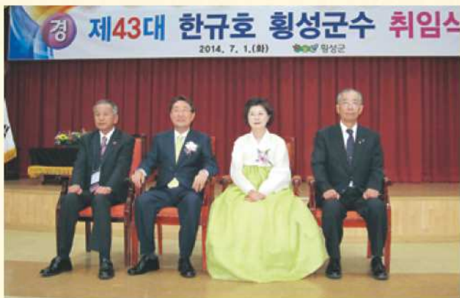
韓郡守夫妻とともに

韓国では、今年の6月4日に統一地方選挙が実施され、この選挙により新しく横城郡の郡守と議長が就任されました。