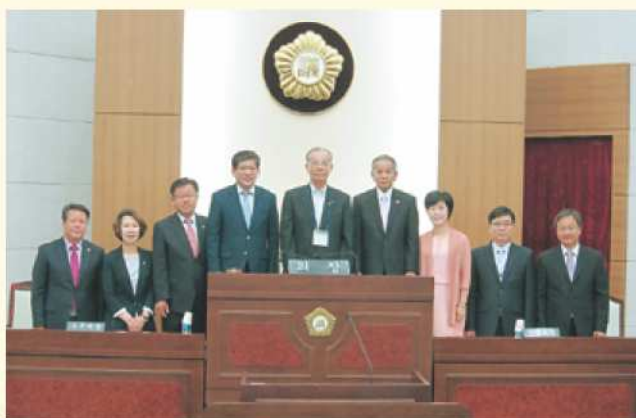
横城郡議会議場で

また、全議員に専用の机、パソコンが整備され、ほぼ毎日議会棟に向かえるなど、熱心に議員活動をされているとのことでした。