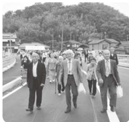
高齢者を先頭に渡り初め

門尾地内の私都川に架かる「門尾橋」が新たに完成し、6月21日（土）、門尾と下門尾集落主催による「門尾橋開通式」が現地で行われました。