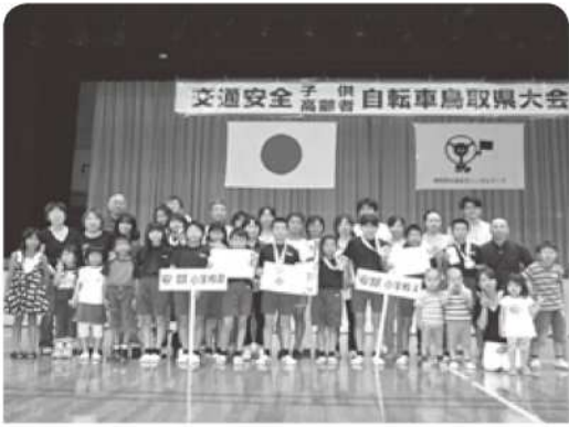
安部小チームと関係者の皆さん

この大会は、交通に対する興味と感心を高め、交通安全知識を身に付け、その習慣化を図り、交通事故を防止するために行われています。