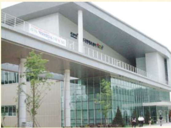
人材育成館の外観

また、夕食などの給食も無料で利用することができ、送迎もバスやタクシーが無料で利用できるなど、裕福な家庭でなくても勉強ができる画期的なシステムだといえます。