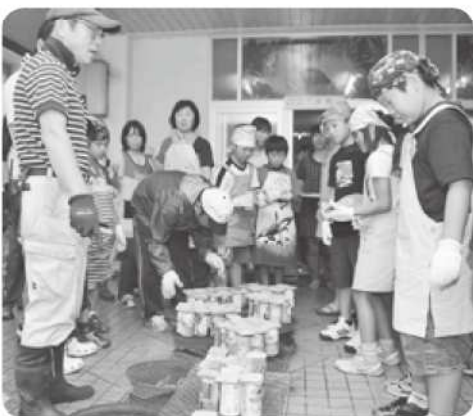
空き缶で炊飯体験

八頭郡レクリエーション協会指導のもと児童たちは、炭火をおこし、空き缶でご飯を炊く体験などを行いました。