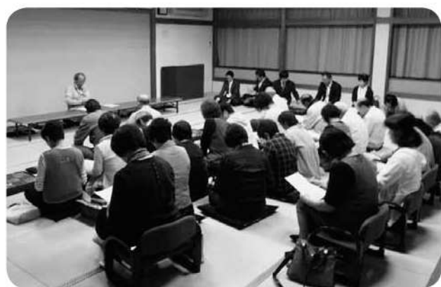
隼地区まちづくり委員会設立会の模様

12月13日には、「第1回まちづくりカフェ」を開催し、委員などを含め62名の方にご参加いただき盛大に行うことができました。初めてという事で参加者の取りまとめや送迎、受付など多少の混乱はありましたが、委員や事業推進員など多くの協力のボランティア精神で、大成功でした。また、愛称を募集し、多数の応募の中から参加者の投票で「ここに来ればみんなが楽しく笑顔になれる。何より声をだして笑うこ