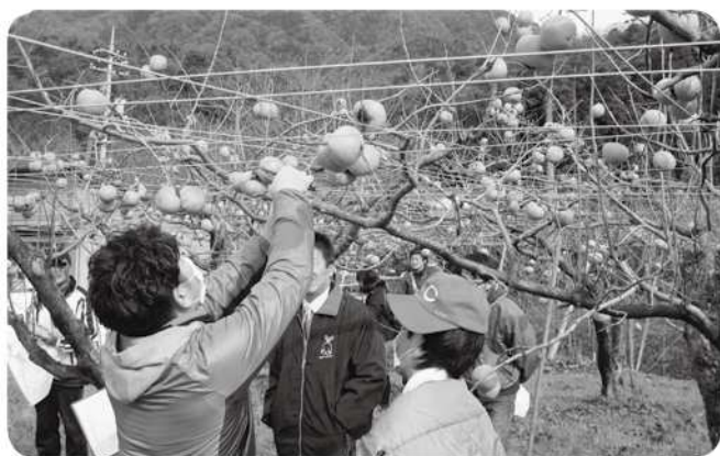
物産館みかどの体験果樹園で花御所柿の収穫を楽しむ皆さん

那家保健センターでは、日赤奉仕団のご協力により、町特産の食材を使った手作りの昼食を摂っていただき、その後、スカットボールゲームや手品観賞などのレクリエーションで楽しい1日を過ごしていただきました。参加された方からは、「来年もまた帰ってきたい」との感