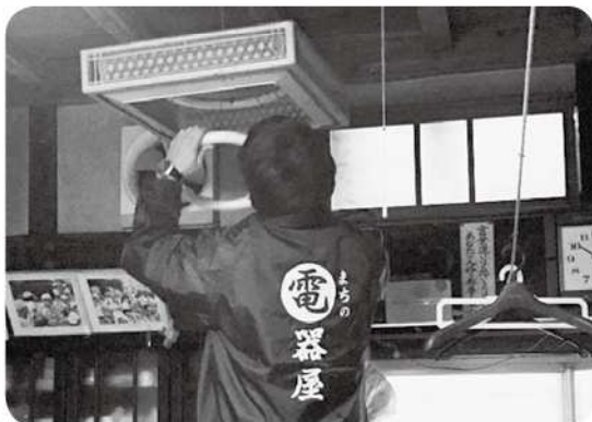
新しい蛍光管に取り替える組合員さん

プラグの間にホコリがたまっていないか、火災の恐れなどのあるリコイル対象の家電製品が使われていないか等、チェックシートに従って一つひとつ確認していきま