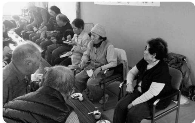
笑顔があふれたクリスマス会(参加者56名)