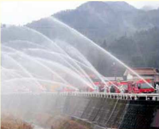
新春の一斉放水(岩淵地内)

(日頃から女性消防隊員の活動に活発であり、特に女性消防隊による救命講習の実施や地域における防火啓発活動の展開などを実施した)