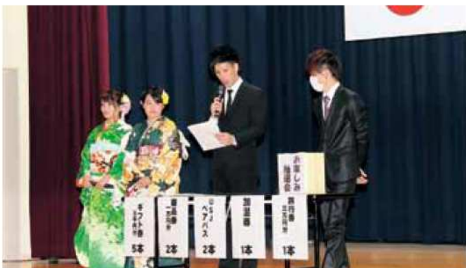
会場を盛り上げる 実行委員会の皆さん

引き続き、「お楽しみ会」として旅行券やUSJスタジオパス・ペア券、加湿器、地元菓子店の菓子箱などが当たる抽選会が行われ、新年の幕開けとなる運試しに会場は大いに盛り上がりました。