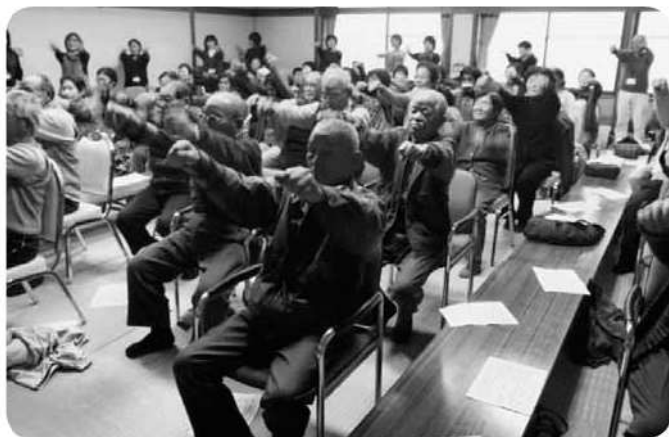
錘を手足に着けて行う『いきいき百歳体操』