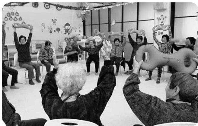
「3B体操」で元気はつらつ

を深め、小学生が高齢者を手伝っていました。帰る際には、高齢者全員とハイタッチをして帰る子どももいて、子ども達と高齢者の心がしつかりとつながっていると実感しました。