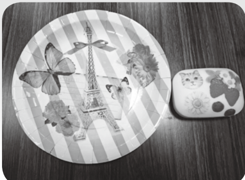
▲完成したデコパージュ石鹸(右)とお皿