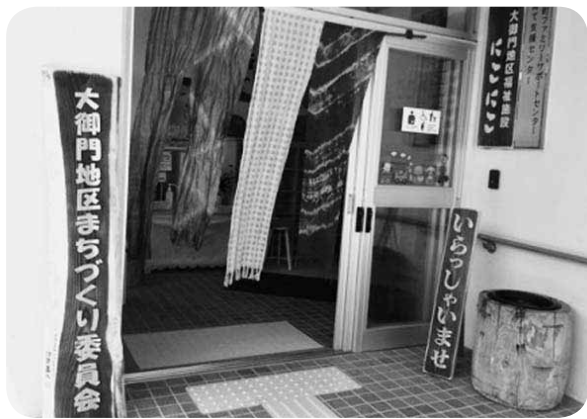
大きな看板がお出迎え

オープン当日は、小学生を含め約50人という大盛況で、今後のカフェの行事予定表を入れた菓子袋を配布して「まちづくりカフェ」の周知を図りました。