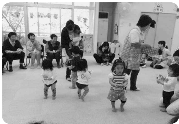
「ミュージック・ケア」で世代間交流

昨年12月に開催した子ども交流会（クリスマス会）では、フェルトのリース作りやビンゴゲームで交流