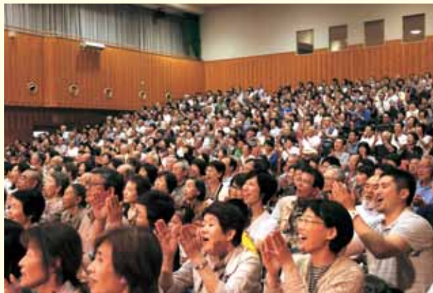
笑いと歓声に包まれた会場