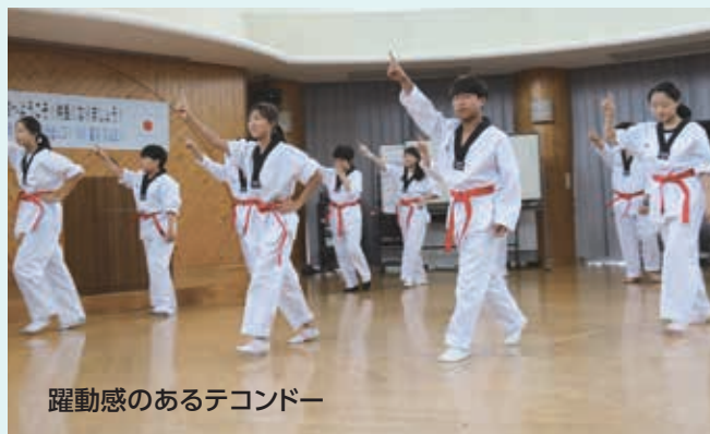
躍動感のあるテコンドー