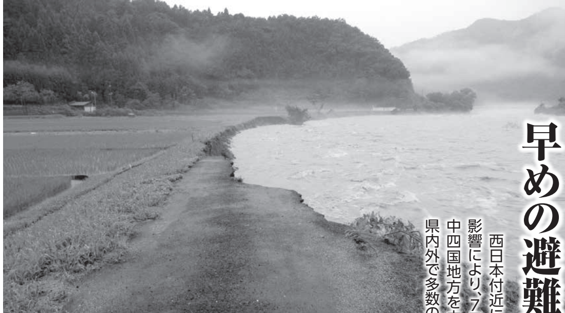
八東川の氾濫により、侵食された農道(7月7日早朝、用呂地内で撮影)

西日本付近に長時間停滞していた梅雨前線の影響により、7月5日(木)から7日(土)にかけて、中四国地方を中心に記録的な大雨に見舞われ、県内外で多数の被害が発生しました。