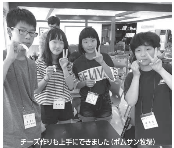
チーズ作りも上手にできました(ボムサン牧場)