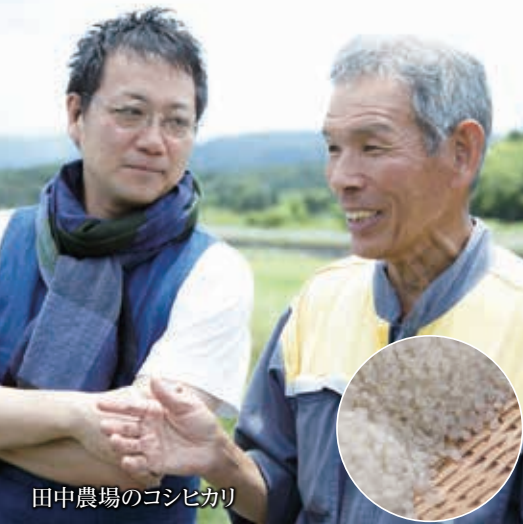
田中農場のゴシヒカリ