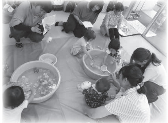
金魚すくいに夢中な子ども達