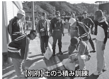
【別府】土のう積み訓練