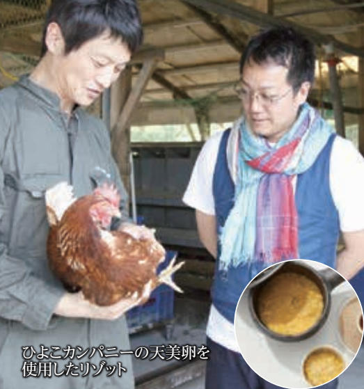
ひよこカンパニーの天美卵を使用したリゾット

今回のイベントを一回きりの楽しかったねと終わる打ち上げ花火にするのではなく、鳥取八頭に誇りを持ちながら、文化として根付いていけるようなイベントに発展させていけたらと思います。