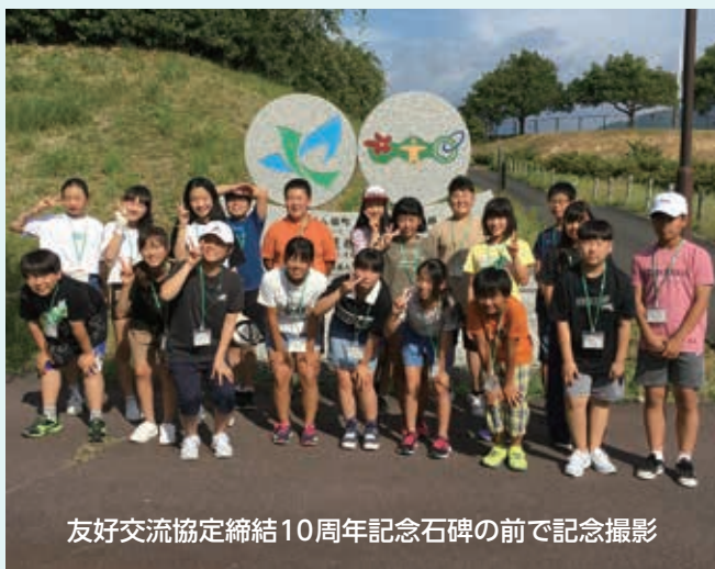
友好交流協定締結10周年記念石碑の前で記念撮影