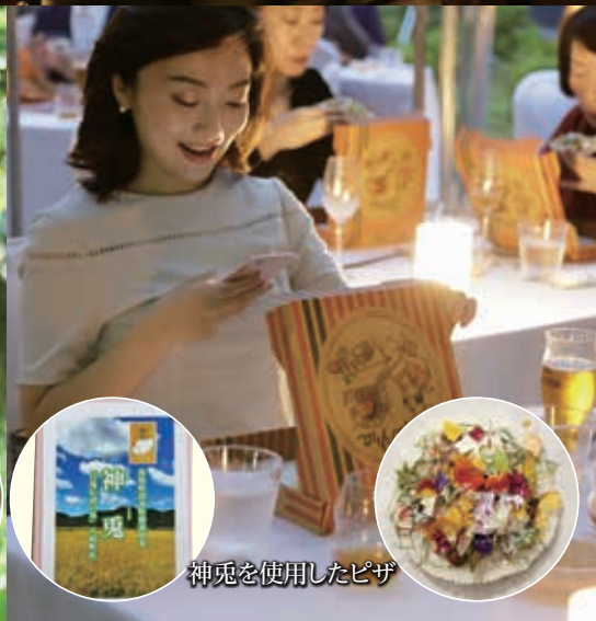
神兔を使用したピザ