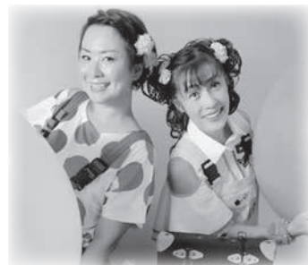
『ちゃお!ちゃお! コンサート』 kiki & soraさん