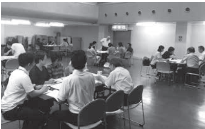
グループに分かれて意見交換中。時間が足りないくらい話が盛り上がりました。

参加者はこの会話例を基に、会話の問題点や自分ならどうするか、どう伝えれば良いかといった改善策などを話し合いました。