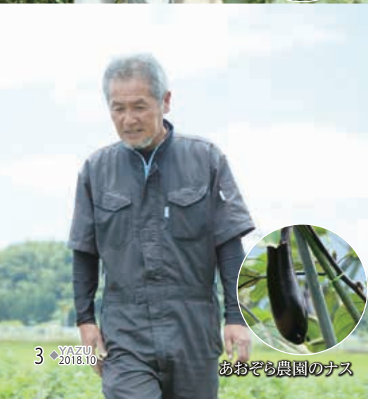
あおぞら農園のナス