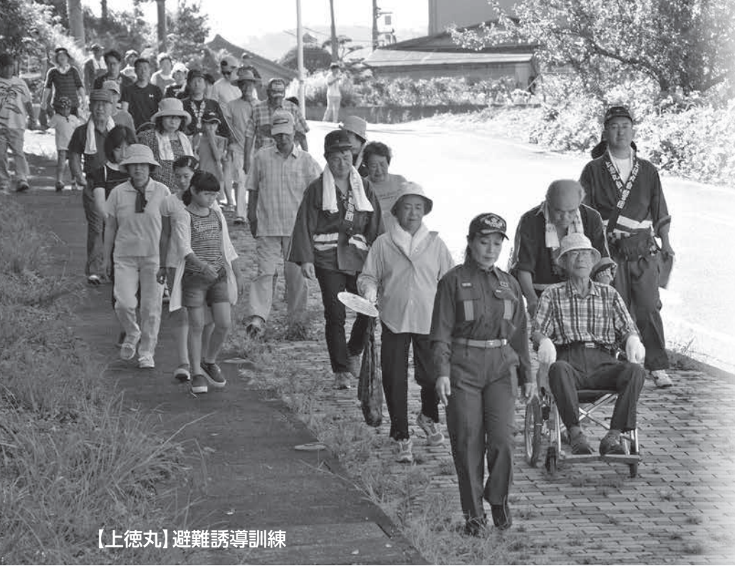
【上徳丸】避難誘導訓練

この訓練は、地域住民による、自助・共助の強化と防災意識の高揚を図るため、平成19年度から9月1日を「八頭町防災の日」と定め、直前の日曜日に実施しているものです。