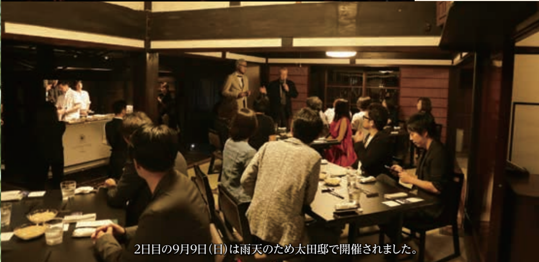
2日目の9月9日(日)は雨天のため太田邸で開催されました。