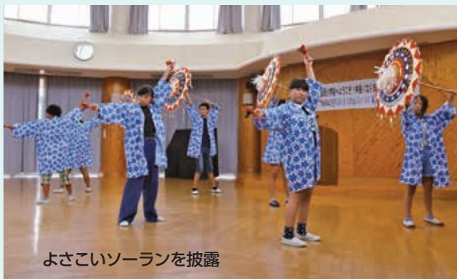
よさこいソーランを披露