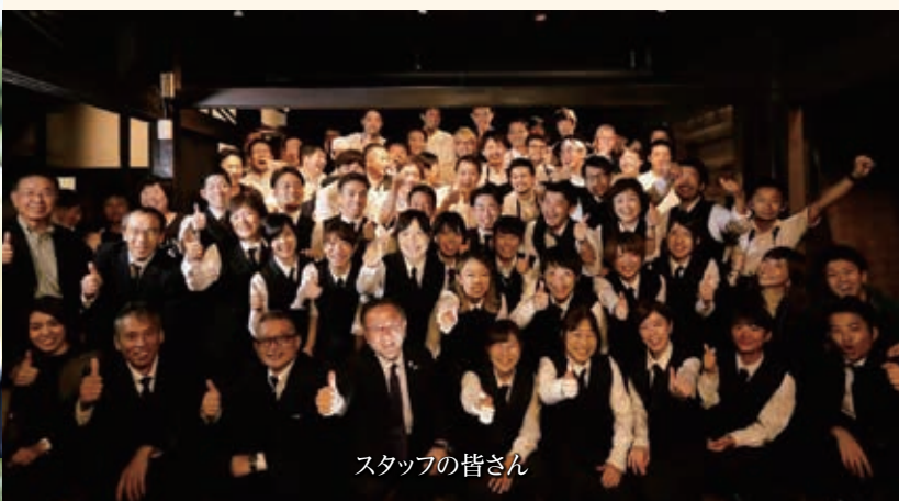
スタッフの皆さん