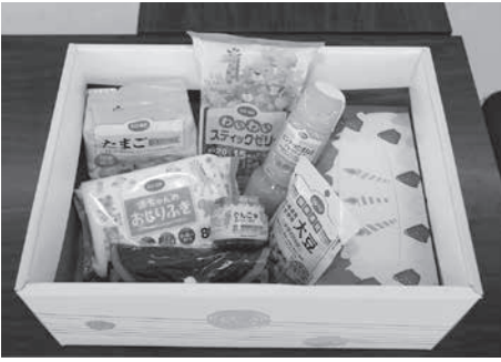
※写真はイメージです。申込方法等は検討中です。

今後も、子育てしやすい地域づくり・地域で子育てを支え合える環境づくりを推進します。