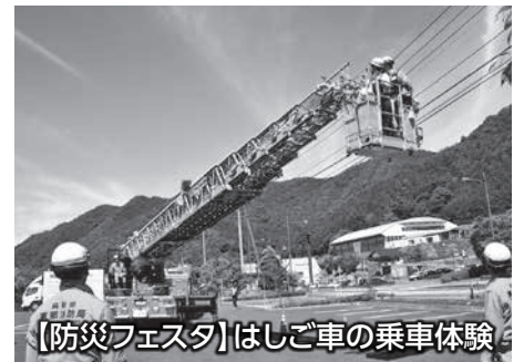
【防災フェスタ】はしご車の乗車体験