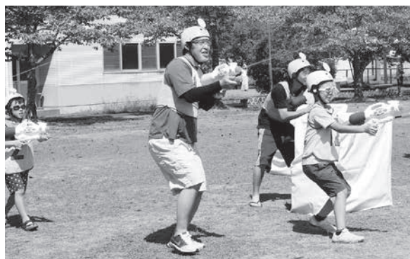
親子で協力して相手を倒すぞ!!

中には対戦相手の全ての的(ポイ)を破ったチームもあり、他の参加者から歓声が上がっていました。