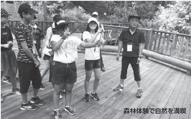
森林体験で自然を満喫

子どもたちに貴重な体験の場を支えてくださった全ての皆様に感謝します。「カムサハムニダ！」