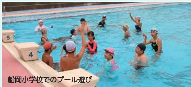
船岡小学校でのプール遊び