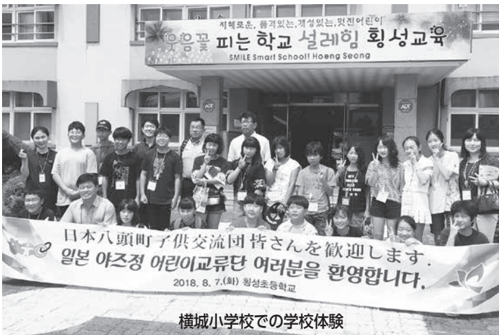
横城小学校での学校体験