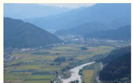
「やずナビ」ホームページ ( http://yazukanko.jp )をご覧ください。

道路沿いの城跡看板から日下部神社を経由して山頂まで約50分と、ハイキングコースとしてもおすすめです。秋の行楽日和に高平山に登ってみてはいかがでしょうか。