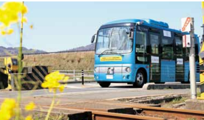
踏切でもきっちり一時停止