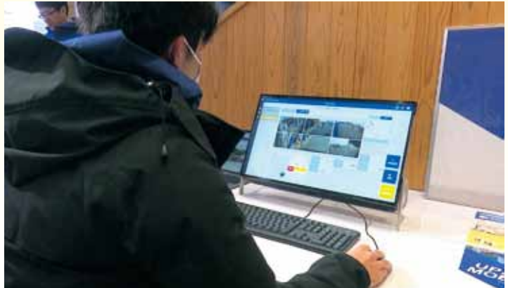
遠隔で監視し乗客の安全を見守り 走行中でも乗客へ声掛けもできる