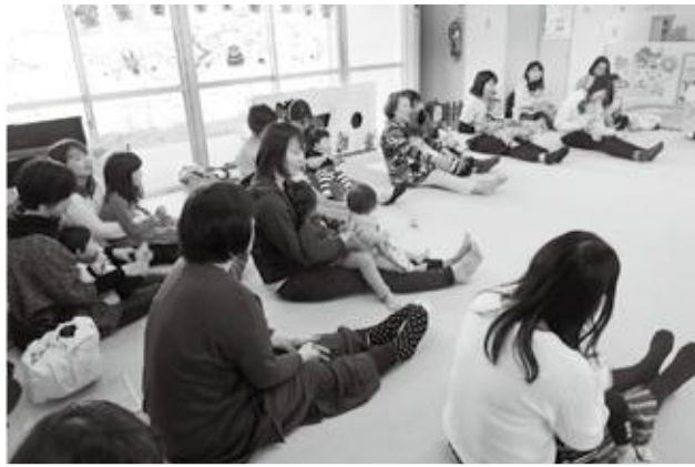
ふれあい遊びでは親子でにっこり

桜の満開を心待ちにしていた4月4日(木)、八頭町子育て支援センターの開講式を行いました。21組の親子が参加し、所長のあいさつ・職員紹介の後、みんなで「ちゅうりつぷ」を歌うなど、手遊び・ふれあい遊びを楽しみました。ふれあい遊びではお母さんの膝に乗って、小さな赤ちゃんもお母さんと一緒に、にっこり。