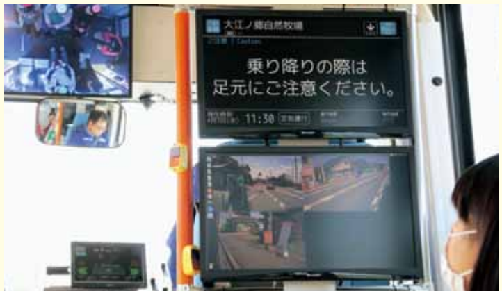
AI 技術により、通行人や通過する車両などを認識