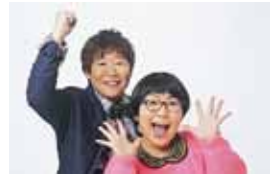
チキチキジョニー