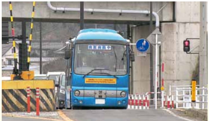
青信号を認識して交差点を通過