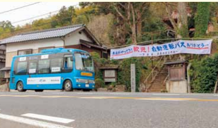
「未来」がすぐそこまでやっています