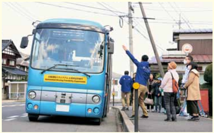
バス停では縁石まで 50cm に沿って幅寄せ