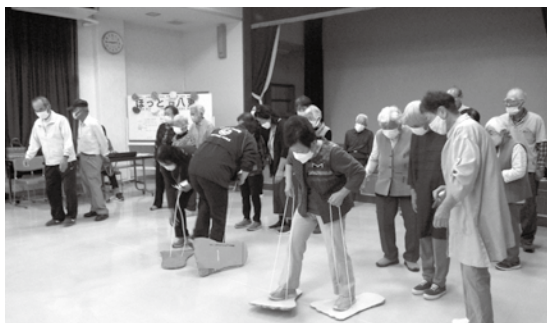
「大きな足跡」 一步一步前に進むことに苦戦!

まちづくり委員会では、カフェやレクリエーションなど楽しい企画をたくさん準備しています。多くの皆様のご参加をお待ちしています。