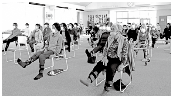
「いきいき百歳体操」 重りをつけて筋力運動

現在の活動拠点である船岡地区福祉施設(旧船岡保育所)には、式典当日、地域の方をはじめ、これまで関わった集落支援員など、73人と多くの方が集まり、節目を祝いました。