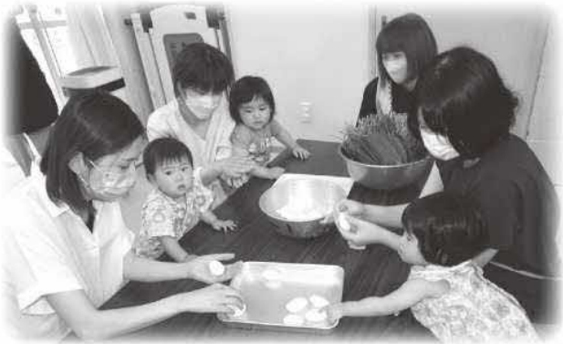
団子をこねこね♪いろいろな笹の巻き方があるんだね

七夕にちなんだお話を聞いたあと、ほんのりとやさしい笹の香りがする笹巻きを美味しくいただきました。