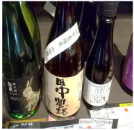
《純米吟醸酒「田中農場」》 (有)田中農場(八頭町下坂)

いしはら商店で購入できる八頭町産「エリンギ」はコリコリとした食感と深い味わいが特徴。「唐揚げ」で食べるのもおすすめです。また、純米吟醸酒「田中農場」は特別栽培米「山田錦」で作られ、酸味のきいた辛口が特徴です。神戸にお越しの際はぜひお立ち寄りください。