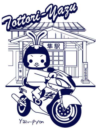
(私の地元・隼駅とやずぴょん)