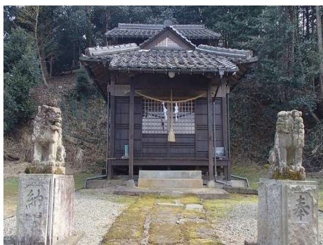
【隼神社】 八頭町見槻中 若桜鉄道『隼駅』から徒歩約5分

八頭町産の梨や柿を原料として使っているリキュール「万葉の宴 梨・柿」は、果肉がふんだんに入っているので素材をしつかり味わうことができます。リキュールで故郷・八頭のフルーツをお楽しみください。 また、ワイン&フードフクイでは、秋の八頭町を代表する味覚「花御所柿」も販売していただいています。花御所柿の時期にはぜひご利用ください。