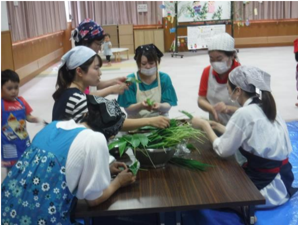
ほん巻きにも挑戦 「むつかしいなあ」