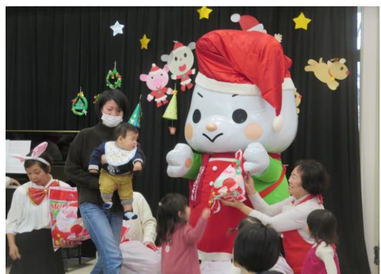
やずびよんからプレゼントをもらったよ