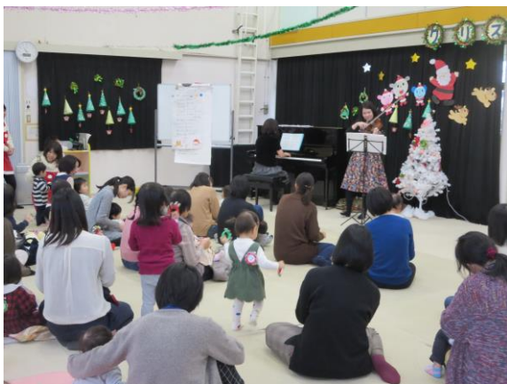
ヴァイオリンの優しい音色にうっとり